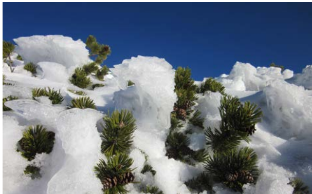
Bergkiefer im Schnee

Im Einsatz handeln die Naturschutzwächterinnen und -wächter im Auftrag des Landratsamtes. Das setzt eine solide Ausbildung voraus. Interessenten, denen diese Tätigkeit seitens der Unteren Naturschutzbehörde anvertraut werden soll, werden in zwei Lehrgangsteilen mit abschließender Eignungsprüfung auf ihren wertvollen Einsatz vorbereitet.