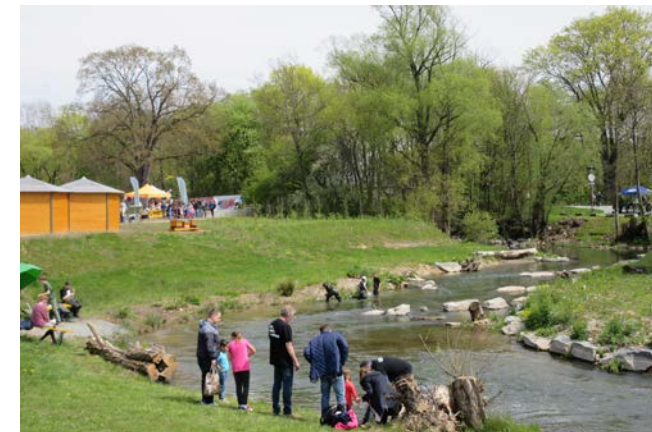
Besucher entdecken den renaturierten Roten Main auf der Landesgartenschau Bayreuth