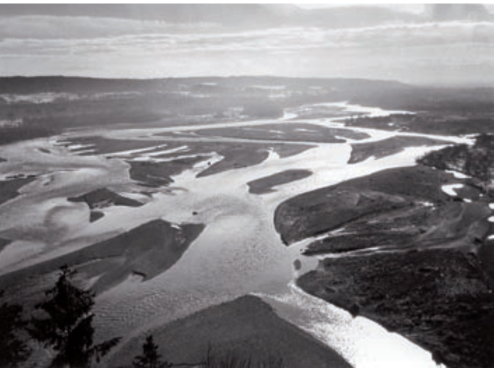
Isarauen bei Wolfratshausen 1949 mit weitläufigem Umlagerungsbereich (Foto: Prof. Otto Kraus, ANL-Archiv).