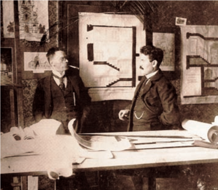
Gabriel von Seidl mit seinem Bruder Emanuel (rechts) um 1885.