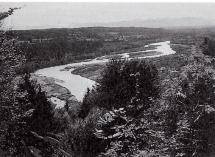
Kanalisiertes Flusslauf bei Wolfratshausen 1969.