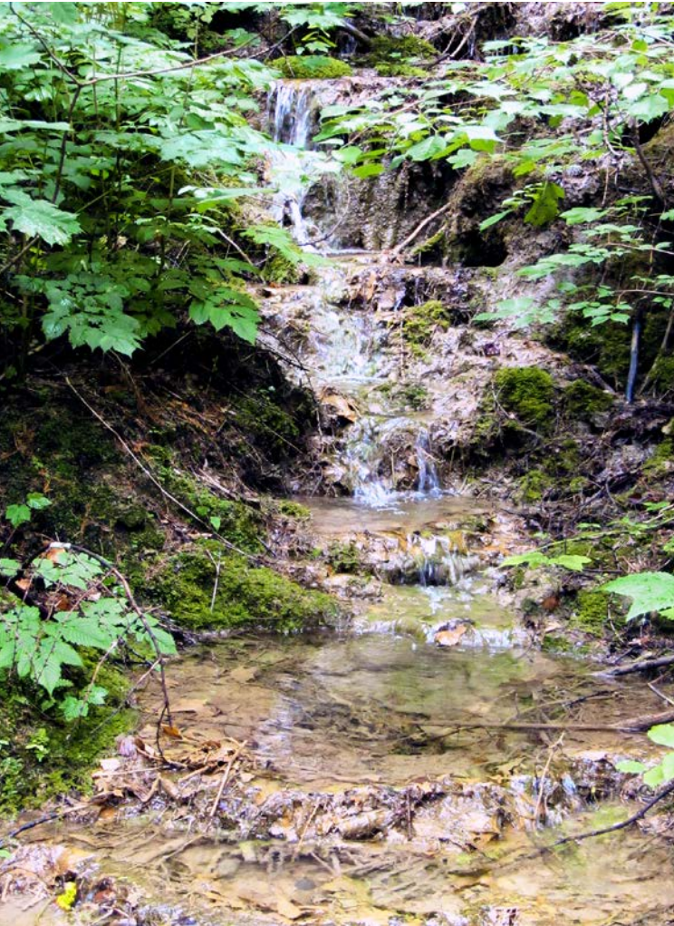
Abb. 4: Typischer Bach mit Feuersalamanderlarven in einem Laubmischwald.