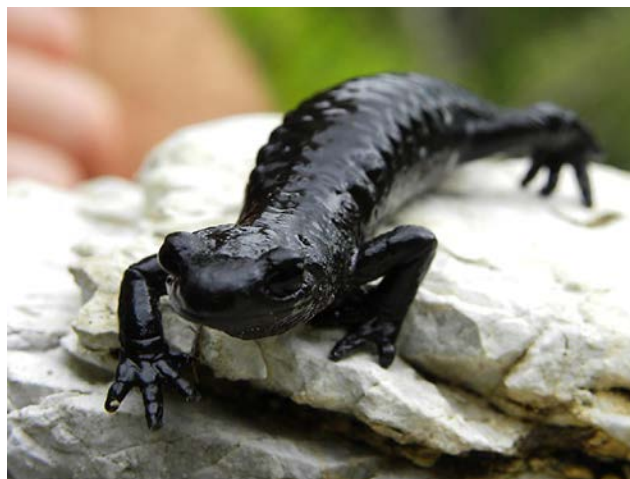
Abb. 1: Der lackschwarze, heimische Alpensalamander.

Die kleinen lackschwarzen Alpensalamander ( Salamandra atra atra ; Abbildung 1) sind bei uns auch unter den Namen Wegnox, Wegnarr, Bergnarr, Wegmandl oder