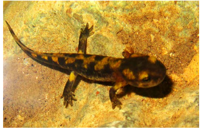
Abb. 3: Junge Feuersalamanderlarve (zirka 3 cm) mit deutlich erkennbaren Kiemenbüscheln am Hinterkopf (links) und rechts eine Larve kurz vor der Metamorphose (zirka 6 cm) mit ausgeprägter schwarz-gelb Färbung.

Fig. 3: Young Fire Salamander larva (about 3 cm long) with prominent gill branches on the backside of the head visible (left) and a larva shortly before metamorphosis (about 6 cm long) displaying a distinct black-yellow coloration (right).