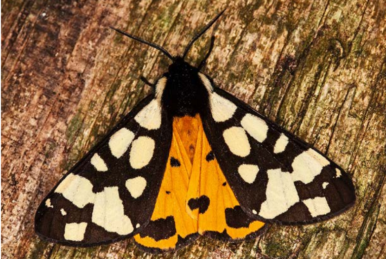
Der Schwarze Bär ( Arctia villica ) ist ein farbenprächtiger Nachtschmetterling, der in Bayern nur noch in einer einzigen Region im Donautal vorkommt.

(MO) Mit mehr als 3.200 Arten stellen die bayerischen Schmetterlinge fast 10 Prozent der gesamten Tierarten Bayerns. Nun haben zwei Experten diese in einer detaillierten Checkliste erfasst und erstmals sowohl deren räumliche wie zeitliche Verbreitung im Freistaat aufgeschlüsselt. Das Werk ist das bisher umfassendste seiner Art und befindet sich taxonomisch auf dem neuesten Stand; die umfangreiche Kommentierung aller identifizierten Schmetterlinge durch die Autoren ist einzigartig für Faunenlisten dieser Größenordnung.