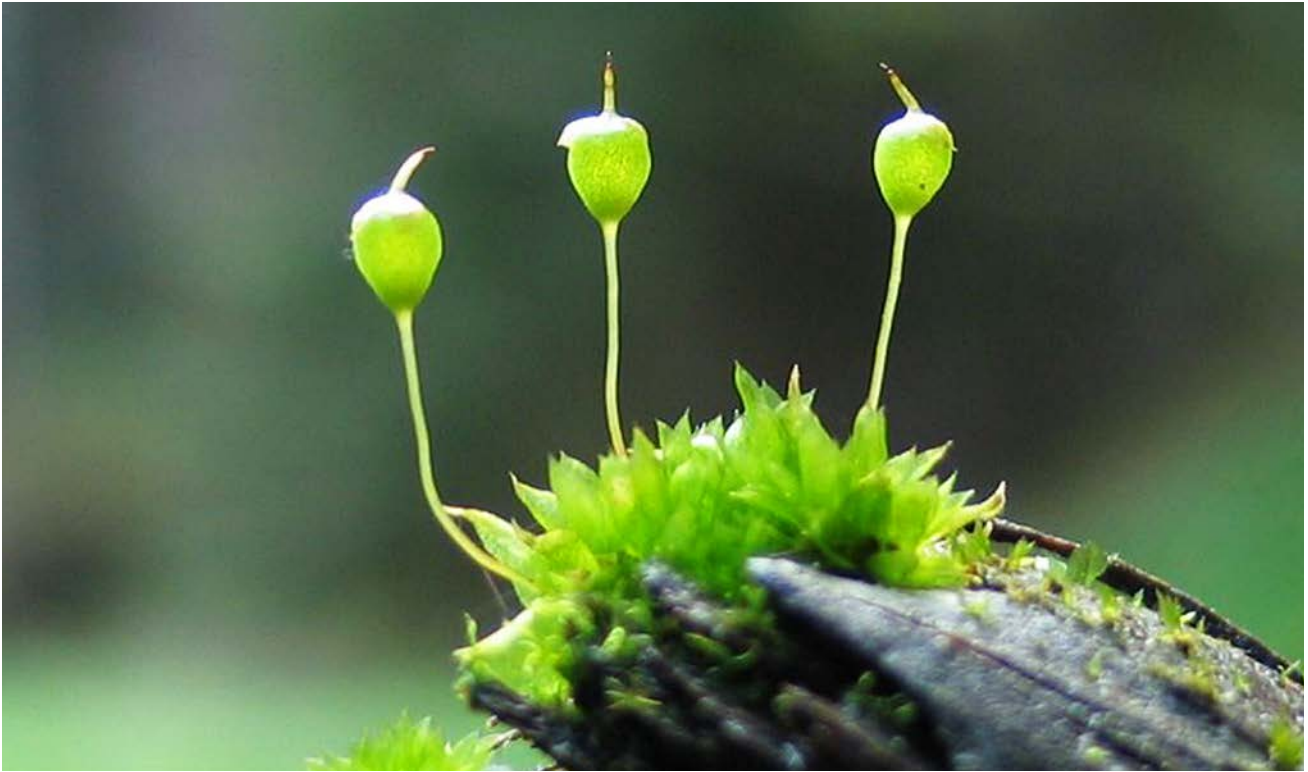
Das Birnförmige Blasenmützenmoos ( Physcomitrium pyriforme ) mit seiner namensgebenden Sporenkapsel ist ein kurzlebiger Pionier, der feuchte und nasse Standorte bevorzugt.

wandte er sich ans Bayerische Landesamt für Umweltschutz (LfU) – wo man ihm schließlich fünf Jahre lang eine Stelle zur Erstellung einer bayerischen Datenbank der Moose, Flechten und Pilze finanzierte. „Ich dachte, jetzt gibt’s zwei Möglichkeiten, diese Zeit zu nutzen. Entweder geh’ ich selber raus ins Gelände zum Kartieren; dann kann ich vielleicht 100.000 Daten erfassen. Oder ich helfe den vielen Experten beim Digitalisieren ihrer eigenen Daten, die sie über Jahrzehnte gesammelt haben; dann kommt sehr viel mehr zusammen“, so der Biologe.