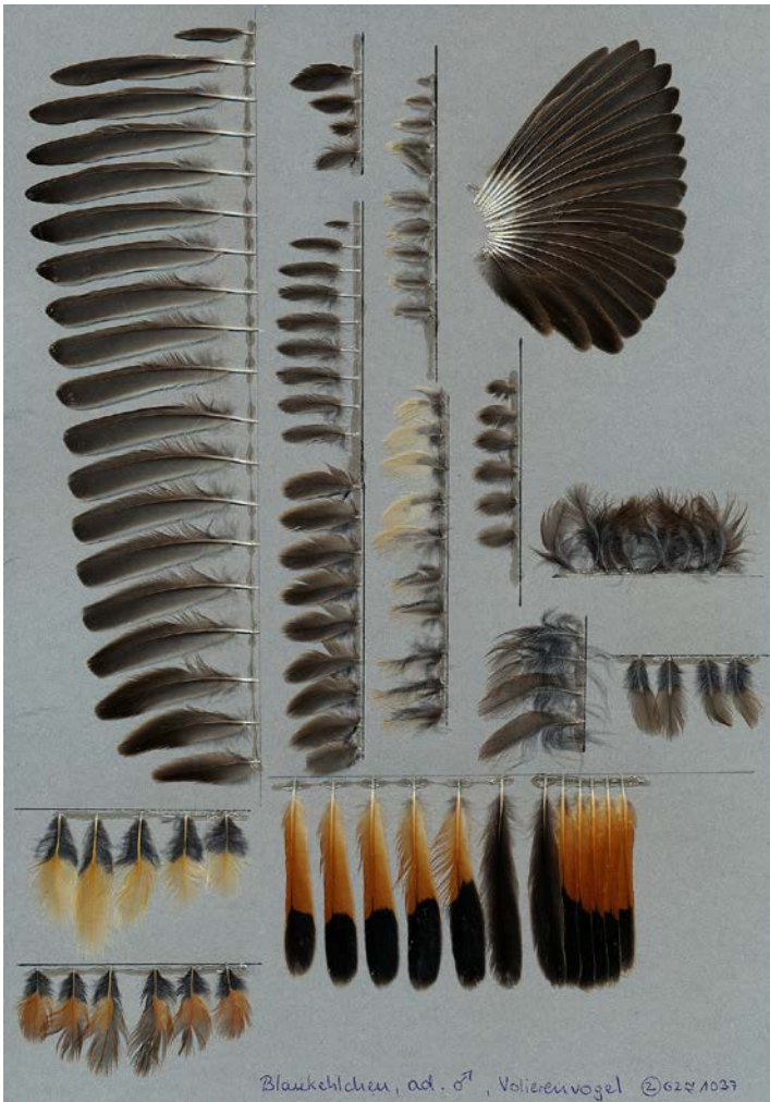
Die Federsammlung mit mehr als 1.500 Fotos und Scans bietet Hilfestellung für Vogelbestimmung anhand von Federn – im Bild die Federn eines Blauehlchens ( Luscinia svecica ).

lungen“, betont Alexander Haase. Mehr als 400 Vogelarten umfasst seine Federsammlung, knapp die Hälfte davon sind einheimische Arten, die übrigen stammen aus aller Welt. 2009 hat er damit begonnen, seine Sammlung anhand von Scans und Fotografien zu dokumentieren und samt den zugehörigen Daten online zu stellen. Dort ist sie unter dem Link www.federbestimmung.de für jedermann einsehbar.