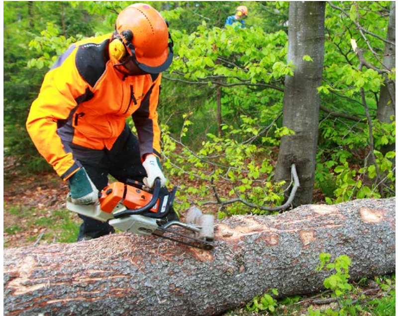
Abb. 1: Bei dem Rindenstreifen (hier maschinell) von sturmgefallenen Fichten sollte darauf geachtet werden, dass das Phloem vollständig durchtrennt wird und keine flächigen Rindenstücke mehr am Stamm vorhanden sind. Grundsätzlich kann die Rinde allerdings auch mit der Motorsäge eingeritzt werden.

Auf künstlich angelegten Fichtenwindwürfen im Nationalpark Bayerischer Wald konnte gezeigt werden, dass durch eine Teilentrindung in Form von Rindenschlitzen die Buchdruckerdichte ähnlich effizient reduziert wird, wie bei einer Komplettentrindung. Allerdings wiesen gestreifte Stämme eine deutlich höhere Artenvielfalt auf als vollständig entrindete Stämme. Dieses Ergebnis erschien in der Fachzeitschrift „Forest Ecology and Management“ (THORN et al. 2016).