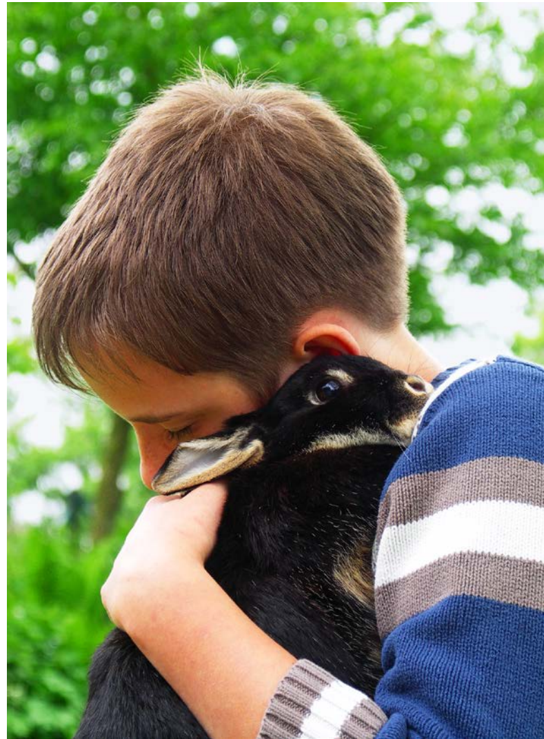
Abb. 3: Der körperliche Kontakt zu Tieren wird oft als therapeutisches Mittel zur Heilung seelischer Störungen eingesetzt (Foto: Antje Deepen-Wieczorek/Piclease).

Die Intervention „soziale Landwirtschaft“ nimmt einen Sonderstatus ein (Abbildung 2). Sie eignet sich für alle Maßnahmen und kann mit allen Naturelementen arbeiten. So dient sie der größten Personengruppe als Therapieform. Dazu werden die Klienten in die Arbeiten des land- oder forstwirtschaftlichen Betriebes eingebunden. Durch das Arbeiten kann auf geistig und körperlich Behinderte, Suchtkranke, psychisch Kranke, ehemals Gefangene und Langzeitarbeitslose therapeutisch oder sozial- und arbeitsintegrativ eingewirkt werden, wohingegen ein Bauernhof für Kinder und Jugendliche einen pädagogischen Zweck erfüllt (WIESINGER 2011b). Diese weite Auslegung des Begriffs „soziale Landwirtschaft“ entspricht der englischen Deutung, die „social farming“ und „care farming“ synonym verwendet (SEMPIK & BRAGG 2013). Im Deutschen werden pädagogische und