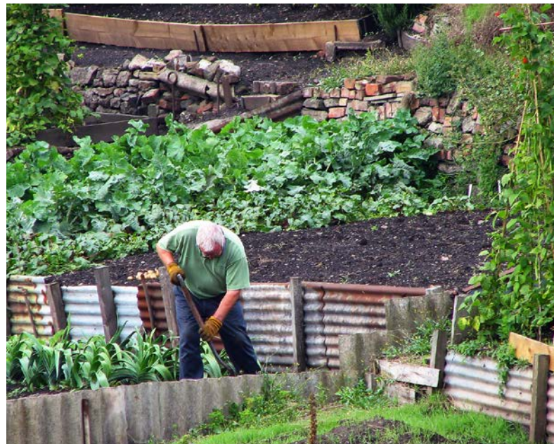
Abb. 1: Gartenarbeit wirkt sich positiv auf Körper und Geist des Menschen aus.

demy for Nature Conservation and Landscape Management (ANL) carried out an analysis on the spread and quality of Green Care facilities in the EuRegio Salzburg – Berchtesgadener Land – Traunstein. By the use of interviews key criteria for the successful implementation of Green Care initiatives were developed.