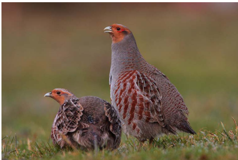
Abb. 2: Der Rückgang des Rebhuhns ist nicht nur aus naturschutzfachlicher, sondern auch aus jagdlicher Sicht eine bedauerliche Entwicklung.

Trotz vieler bindender internationaler Abkommen und politischer Willensbekundungen ist Europa und speziell auch Deutschland weit von seinem Versprechen entfernt, den Artenschwund bis 2020 zu stoppen. Der Artenschutzbericht des Bundesamtes für Naturschutz fasst den Zustand der Artenvielfalt als alarmierend zusammen (BfN 2015). Besonders deutliche Verluste an Fläche und Qualität sind beim artenreichen Grünland zu verzeichnen (EEA 2015). Während von 1990 bis 2012 der Umfang der ackerbaulich genutzten Fläche nahezu unverändert geblieben ist, ist der Flächenanteil des extensiven Grünlands signifikant zurückgegangen (beispielsweise bei Streuwiesen und Hutungen um 26 %; BfN 2014). Nach mittlerweile rund zwanzig Jahren konnten sowohl Agrarumweltmaßnahmen als auch Kulturlandschafts- oder Vertragsnaturschutzprogramme – trotz zweifelsfreier lokaler Erfolge – weder den sehr schnellen flächenmäßigen Rückgang dieses Landschaftstyps stoppen, noch einen guten Erhaltungszustand der europaweit bedeutsamen Grünlandtypen bewirken (BMU & BfN 2011; ELLWANGER et al. 2014). Indikatorengruppen wie Feldvögel (METZNER et al. 2010) oder Schmetterlinge (EEA 2013) belegen die gleiche, stark negative Entwicklung. Als Ergebnis der bisherigen Entwicklung haben heute weniger als 12 % der landwirtschaftlich