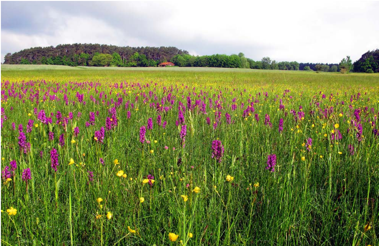
Abb. 1: Blütenreiches Grünland – hier eine Orchideenwiese – ist mittlerweile eine absolute Rarität in unserer Agrarlandschaft.