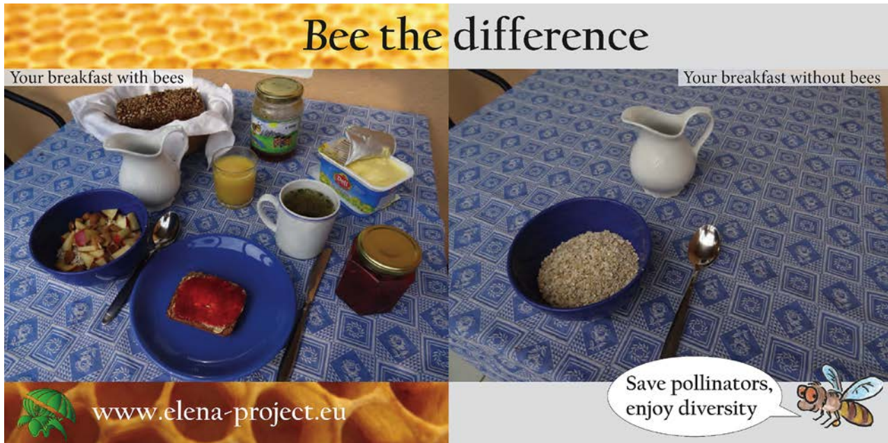
Abb. 4: Eine Postkarte zur Visualisierung von Bestäuberleistung von Honig- und Wildbienen, entwickelt im Rahmen des ELENA-Projektes der ANL (Fotos: Elisabeth Brandstetter/Biosphärenregion Berchtesgadener Land).

wirtschaftungsmethoden im Ackerbau bedroht: Vergrößerung der Schläge, geringe Fruchtfolge, Pestizideinsatz, tiefe Bodenbearbeitung, Anbau ungünstiger Feldfrüchte wie zum Beispiel Mais. In allen Bundesländern ist eine Verschlechterung zu verzeichnen (BfN 2014b). Größere Hamstervorkommen gibt es nur noch in Gebieten mit entsprechend kleinen Schlägen, zum Beispiel im Realteilungsgebiet in Franken. Schutzmaßnahmen, wie die in den Niederlanden eigens für den Hamsterschutz eingerichteten Schutzgebiete, kosten mittlerweile Millionen von Euros (vergleiche www.gaiazoo.nl ). Soweit darf es in Deutschland nicht kommen!