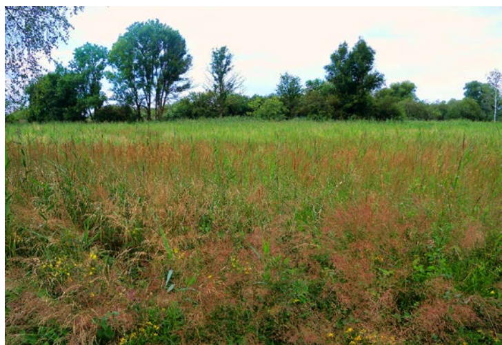
Abb. 4: Links: Verbuschte Fläche mit Grasfilz nach 4 Jahren ohne Mahd. Rechts: Dieselbe Fläche, nachdem die Mahd wieder aufgenommen wurde.