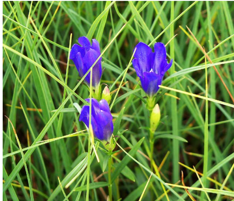
Abb. 1: Der Lungen-Enzian ( Gentiana pneumonanthe ) ist eine attraktive Kennart der artenreichen Pfeifengras-Streuwiesen auf feuchten bis wechselfeuchten, nährstoffarmen Standorten.

For over three decades there is consensus, that many anthropogenic ecosystems can only be retained through active landscape management. This applies in particular to bedding meadows, whose management involves considerable costs. It is a long-term concern of the author to deal with the issue of whether this management leads to permanent preservation and the financial expenditure is worthwhile. In the nature conservation area “Mertinger Hölle”, the author has been able to make use of 30 years of vegetation investigations of permanent observation sites. These sites lie in bedding meadows that lay fallow for about 25 years and are mown again once a year since 1982. This analysis showed that the original quality of the bedding meadows before the fallow could not yet be attained. However, the annual mowing successfully counteracts the auteutrophication as well as the nutrient infiltration through the flood waters of the Danube and leads overall to an improvement from a nature conservation point of view.