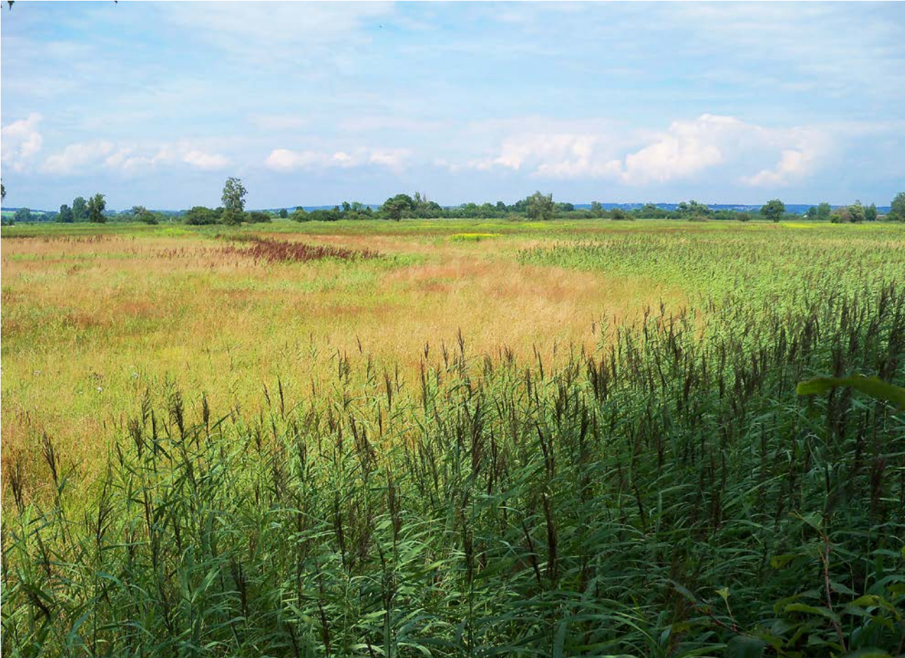
Abb. 2: Blick auf das Naturschutzgebiet Mertinger Hölle aus Südwesten. Die großen, von Schilf bestandenen Flächen sind ein deutlicher Hinweis auf die Nährstoffproblematik im Gebiet.