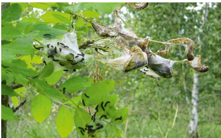
ABBILDUNG 4 Die auffälligen Raupen- und Gespinste des Maivogels sind für Erfassungen besser geeignet als die Falter.

und bei Leipzig in Sachsen sowie in Sachsen-Anhalt vertreten; vom Heckenwollafter ( Eriogaster catax ) existieren außerhalb Bayerns nur noch Vorkommen in Rheinland-Pfalz sowie in Thüringen, grenzüberschreitend zu Bayern. Die bayerischen Vorkommen sind überwiegend an traditionell bewirtschaftete Mittel- oder Niederwälder gebunden: Durch regelmäßige Stockhiebe werden lichte Waldbestände ähnlich jenen Habitaten geschaffen, die ursprünglich durch ungehinderte natürliche Prozesse wie Hochwasser, Phytophagenfraß oder extreme Wetterphänomene entstanden sein können. Die Mittel- und Niederwälder mit ASK-Nachweisen dieser Schmetterlingsarten liegen überwiegend innerhalb von Natura 2000-Gebieten (Tabelle 2). Nur sporadisch gab es einzelne Funde außerhalb der Schutzgebietsgrenzen; ein sehr kleines Vorkommen des Heckenwollafters wurde erst nach Ausweisung entdeckt. Eine Ausnahme bilden die Vorkommen des Maivogels im Berchtesgadener Land; sie liegen zum Teil außerhalb der Natura 2000-Gebiete in Landschaften mit stark verzahnten Waldinseln, Windwürfen, Streuwiesenbrachen, Streuwiesen und Grünland, wo die Falter junge oder tief beastete und gut besonnte Eschen an feuchten Standorten zur Eiablage und Raupenentwicklung vorfinden.