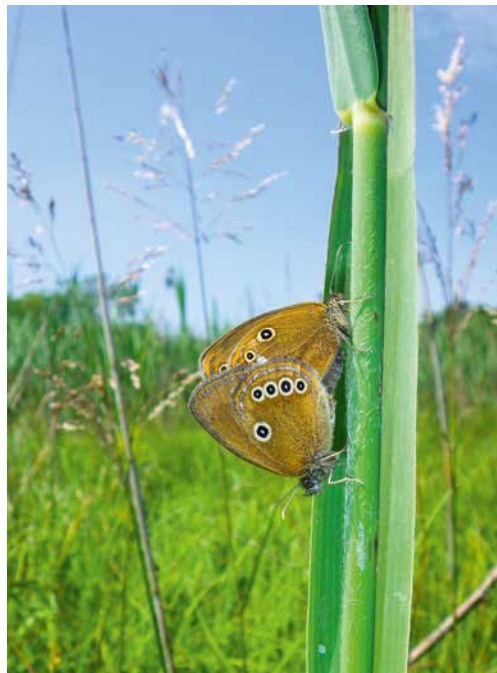
ABBILDUNG 2 Moor-Wiesenvögelchen – hier bei der Paarung – kann man innerhalb Deutschlands nur in Bayern beobachten.

Insbesondere die ANL-Forschung brachte neue Erkenntnisse zur Ökologie der Raupen und ermöglichte damit große Verbesserungen bei der Habitatentwicklung, in deren Folge die