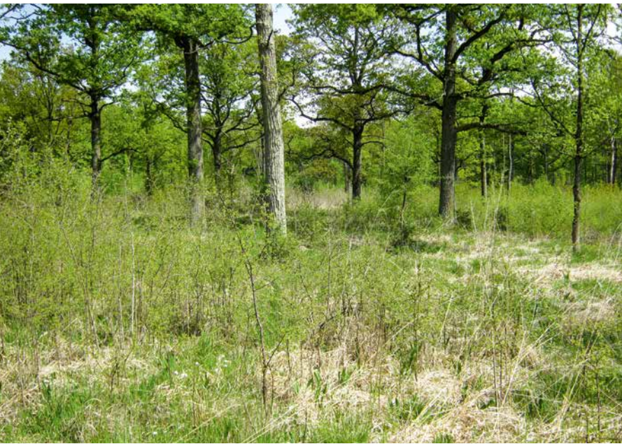
ABBILDUNG 3 Der Mittelwald als Lebensraum für den seltenen Heckenwollafter und viele weitere Schmetterlinge des lichten Waldes.

Erfolg ist eine an den Bedürfnissen der Raupen orientierte Habitatpflege: Jegliche Nutzung muss ebenso weitgehend unterbleiben, wie eine zu starke Verbuschung und Verschilfung verhindert werden muss. Die Raupen brauchen kleine sonnige Lücken in der ansonsten dichten Grasmatrix über einer starken Streudecke und benötigen wintergrüne Gräser beziehungsweise Sauergräser als Raupennahrung (ČELIK et al. 2014; BRÄU et al. 2010).