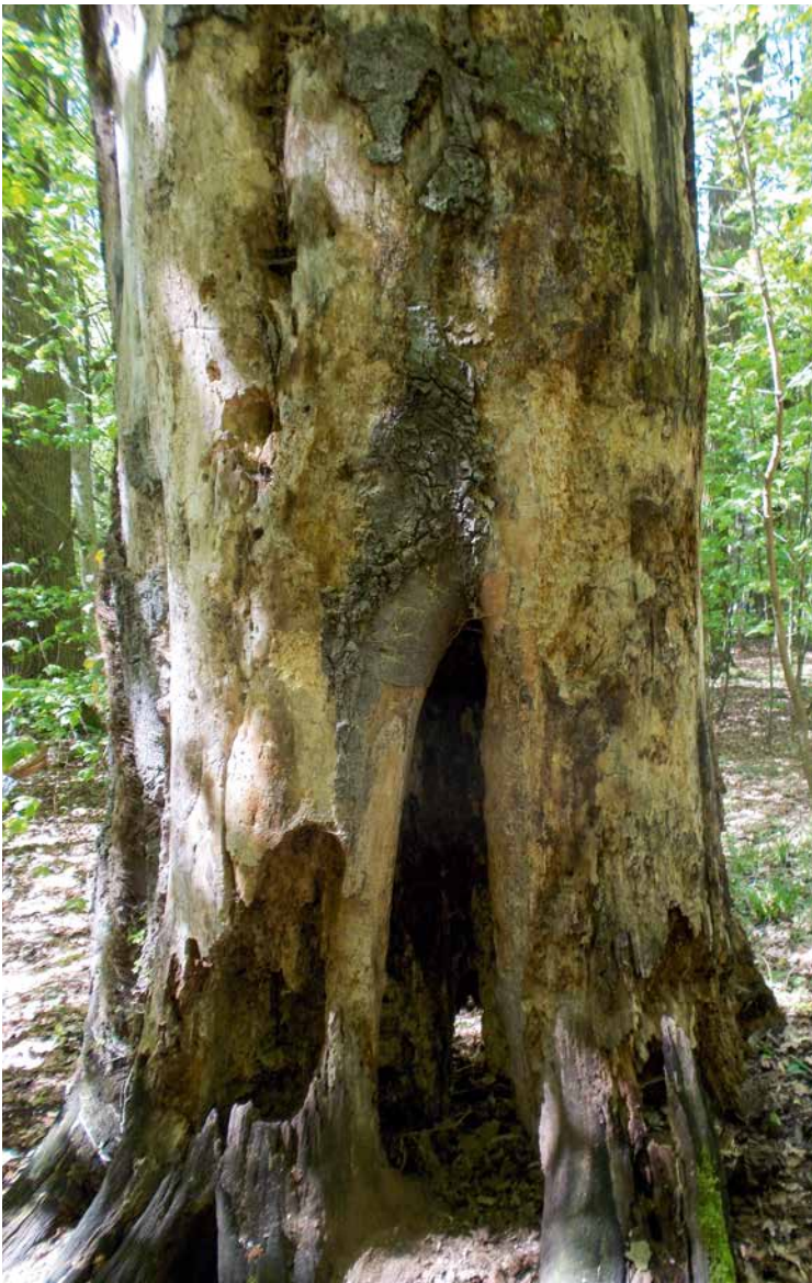
ABBILDUNG 2 Ehemalige Mulmhöhle am Stammfuß einer vor 15 Jahren noch lebenden Buche. Viele der xylobionten Arten, wie auch die Mulmhöhlenbesiedler Eremit und Veilchenblauer Wurzelhalsschnellkäfer, sind auf lebende Bäume angewiesen.

Diese Käfer brauchen Baumstrukturen, die wir ihnen ganz offensichtlich in »normal« bewirtschafteten Wäldern nicht bieten. Dies bedeutet aber nicht, dass wir sie ihnen nicht bieten können, und auch nicht, dass durch die Aufgabe der Nutzung oder Pflege für diese Arten »alles gut wird«. Im Gegenteil sind sogar die meisten xylobionten Arten auf den gezielten Erhalt ihrer Habitatbäume gegenüber »jüngerer Konkurrenz« angewiesen. Dies ist beispielsweise für den Heldbock in Mitteleuropa von essenzieller Bedeutung. Diese Art benötigt sehr alte, aber noch lebende Eichen (vorzugsweise Stieleichen), die weitgehend besonnt stehen. Solche Bäume kommen »im Reich der Buche« jedoch natürlicherweise nicht vor. Dagegen benötigt der Veilchenblaue Wurzelhalsschnellkäfer spezielle Mulmhöhlen am Stammfuß von lebenden Laubbäumen (HUSLER & HUSLER 1940). Solche Mulmhöhlen brauchen Jahrzehnte, bis sie entstehen. Es ist daher wichtig, auch im Wald frühzeitig solche Bäume von Durchforstungseingriffen auszunehmen und dauerhaft zu markieren. Wir müssen aber auch Sorge tragen, dass Bäume mit vorhandenen Mulmhöhlen, soweit es Lichtbaumarten sind, nicht überwachsen werden und durch Verschattung absterben. Gezieltes Habitatmanagement ist auch im Wald notwendig, wenn auch zum Teil weniger offenkundig als im Offenland.