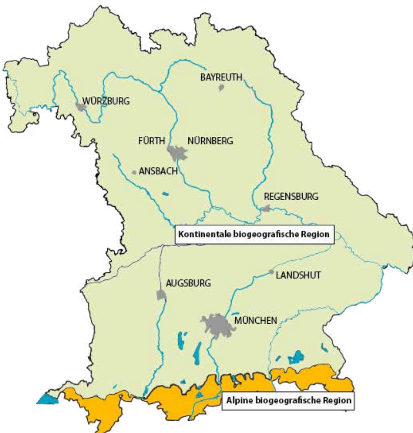
ABBILDUNG 2 Bayern hat Anteil an zwei biogeografischen Regionen. Für jede werden die Erhaltungszustände der Arten und LRT im Rahmen des FFH-Berichts bewertet (Karte der biogeografischen Regionen in Bayern).

Im Bereich der Wald-LRT werden in jeder Berichtsperiode mehr als 150 Stichprobenflächen von den Spezialisten der regionalen Kartierteams unter die Lupe genommen. So können Veränderungen auch in scheinbar so stabilen Ökosystemen wie Wäldern zuverlässig erkannt und letzte Wissenslücken geschlossen werden.