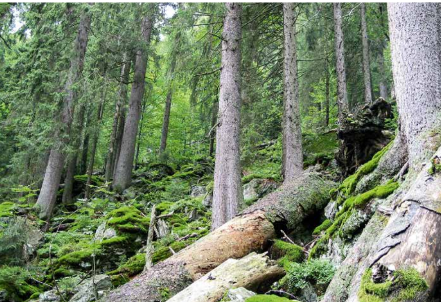
ABBILDUNG 4 Fichten-Blockwald im Bayerischen Wald, der zum Lebensraumtyp 9410 »Bodensaure Nadelwälder der Bergregion« gehört.

In Anhang D werden die LRT des Anhangs I der FFH-RL bewertet. Beispiele hierfür sind: 6510 »Magere Flachland-Mähwiesen«, 8310 »Nicht touristisch erschlossene Höhlen«, 9130 »Waldmeister-Buchenwald« oder 9410 »Bodensaure Nadelwälder der Bergregion« (Abbildung 4).