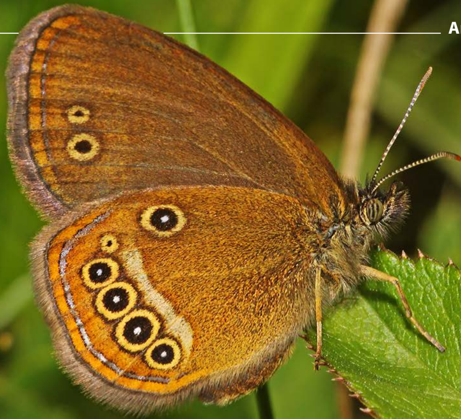
Abbildung 1 Das europaweit bedrohte Moor-Wiesenvögelchen hat in Deutschland nur noch ein Vorkommen. Daher wurde ein mehrjähriges Forschungsprojekt durchgeführt, um dieses durch gezielte Maßnahmen zu stützen und die Basis für Wiederansiedelungsversuche zu liefern.

Markus BRÄU, Robert VÖLKL und Christian STETTMER