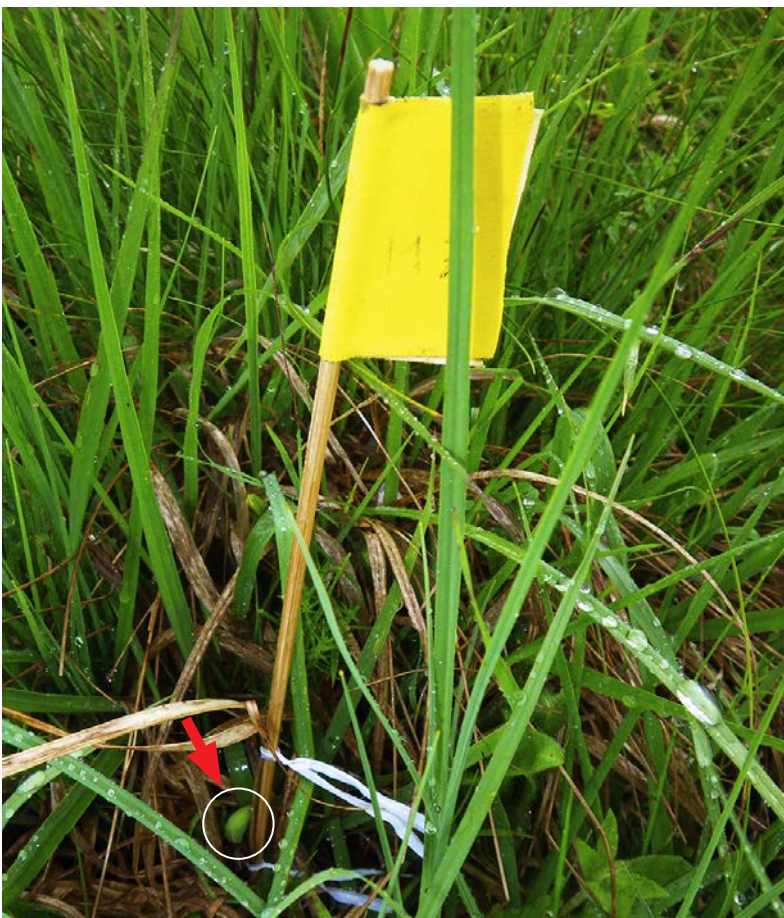
Abbildung 4 Stäbchen mit daran befestigter, gut getarnter Puppe.

sammen mit den bereits zu Anfang entbuschten Erweiterungsbereichen der Haupthabitatflächen (in Abbildung 3 nicht separat bilanziert), die Gesamtpopulation ganz wesentlich.