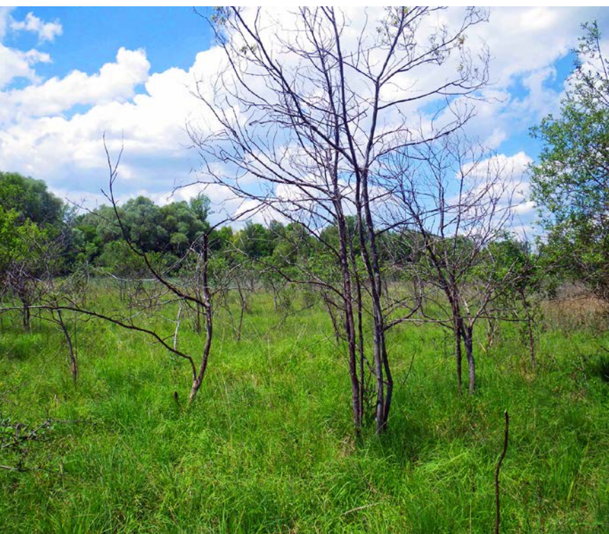
Abbildung 2 Typischer Habitatausschnitt (Fläche HB) mit teils abgestorbenen Büschen zur Flugzeit.

In diesem Beitrag stellen wir vor, wie die in einem Forschungsprojekt gewonnenen Erkenntnisse zur Ökologie des Moor-Wiesenvögelchens (BRÄU et al. 2016) zur Stützung des anfangs individuenschwachen Vorkommens erfolgreich genutzt wurden. Weiterhin berichten wir über die Versuche zur Wiederansiedelung der Art in weiteren Gebieten.