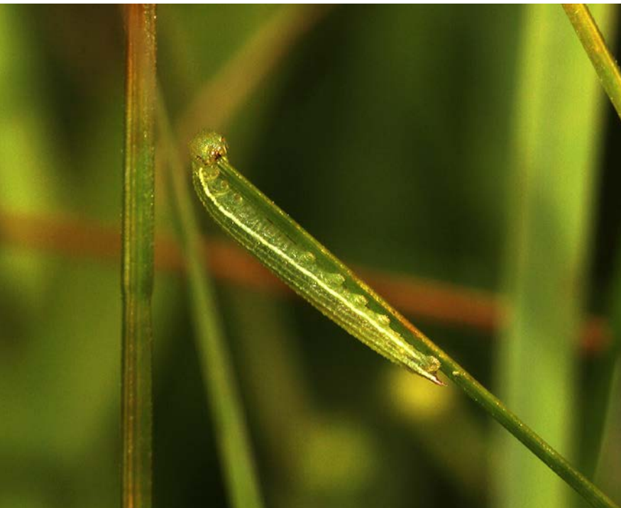
Abbildung 7 Erfolg! Jungraupe von C. oedippus an Davall-Segge ( Carex davalliana ) im Wiederansiedlungsgebiet.

Die nachfolgende Ausbringung 2011 mit geänderter Methode in einem Flugkäfig war erfolgreich: Nach dem Abbau des Flugkäfigs konnte vor der Überwinterung eine Jungraupe an der wie C. panicea wintergrünen Davall-Segge ( Carex davalliana ) fressend gefunden werden (siehe Abbildung 7). Weitere Kontrollen Anfang April nach der Überwinterung und Mitte Mai vor der Verpuppungsphase erbrachten ebenfalls Raupenfunde.