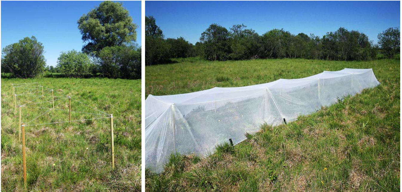
Abbildungen 5 und 6

Es wurden Flugkäfige errichtet, um die Eier legenden Weibchen gezielt in optimal geeigneten Teilen der Fläche zu konzentrieren.