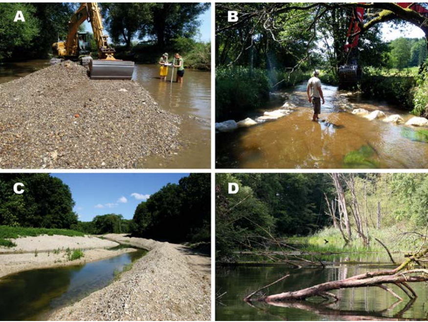
Abbildung 1 Typische Beispiele für Maßnahmen zur Restaurierung von Fließgewässern: (A) Substratrestaurierung zur Förderung kiesliebender Fischarten, (B) Strukturverbesserung zur Erhöhung der Habitatdiversität, (C) Wiederherstellung der fischökologischen Durchgängigkeit, beispielsweise durch Umgehungsgewässer, (D) Einbringen von Totholz als Unterstand und Juvenilhabitat für Fische.

wird die wichtige Chance vergeben, bei der Maßnahmenumsetzung nachzusteuern. Erfolgreiche Schutz- und Restaurierungskonzepte zeichnen sich daher durch ein systematisches und evidenzbasiertes Vorgehen aus (Abbildung 2). Es beinhaltet folgende sieben Schritte: