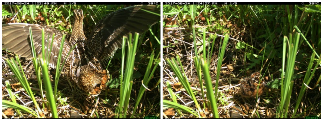
Abbildung 3 Brutnachweis der Bekassine ( Gallinago gallinago ) auf der Fläche „Schnellenzipf“ bei Bischofsreut (Fotos: LfU).