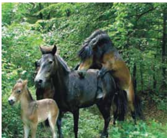
Abbildungen 3 und 4

Dieses Fohlen wurde unter dem Schirm alter Eichen geboren