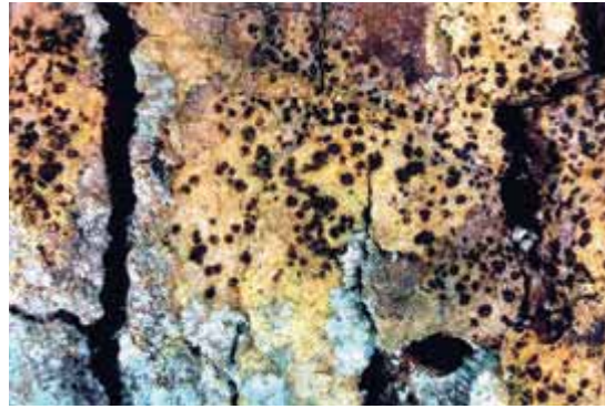
Abbildung 9 Die rindenbesiedelnde Flechte Arthonia vinosa – ein Beispiel für zahlreiche gefährdete Arten im Projektgebiet, die gut besonnte Eichenstämme besiedeln

Eichen abhängig, woraus sich unweigerlich die Notwendigkeit ableitet, der Ausdunkelung durch die Rotbuche entgegenzuwirken.