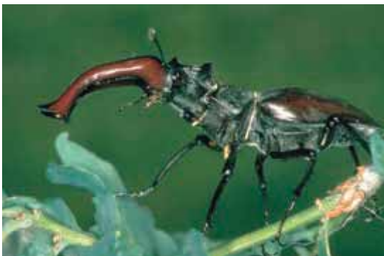
Abbildung 8 Der Hirschkäfer kann als Symboltier für eichenreiche Hutelandschaften angesehen werden (Foto: J. Borris)

Von grundlegender Bedeutung ist der Befund, dass dem Projektgebiet – namentlich den lichten Eichenwäldern – aus Sicht des Arten- und Biotopschutzes eine außerordentlich hohe Bedeutung zukommt, die die bisherigen Vermutungen deutlich übersteigt. Davon zeugen insbesondere über 450 (!) Arten der Roten Listen (Status 0 bis 3), darunter mehrere Arten der FFH-Anhangsliste II sowie mehrere Wiederfunde landesweit verschollen geglaubter Arten. Eine Vielzahl dieser Arten ist unmittelbar vom Vorhandensein alter