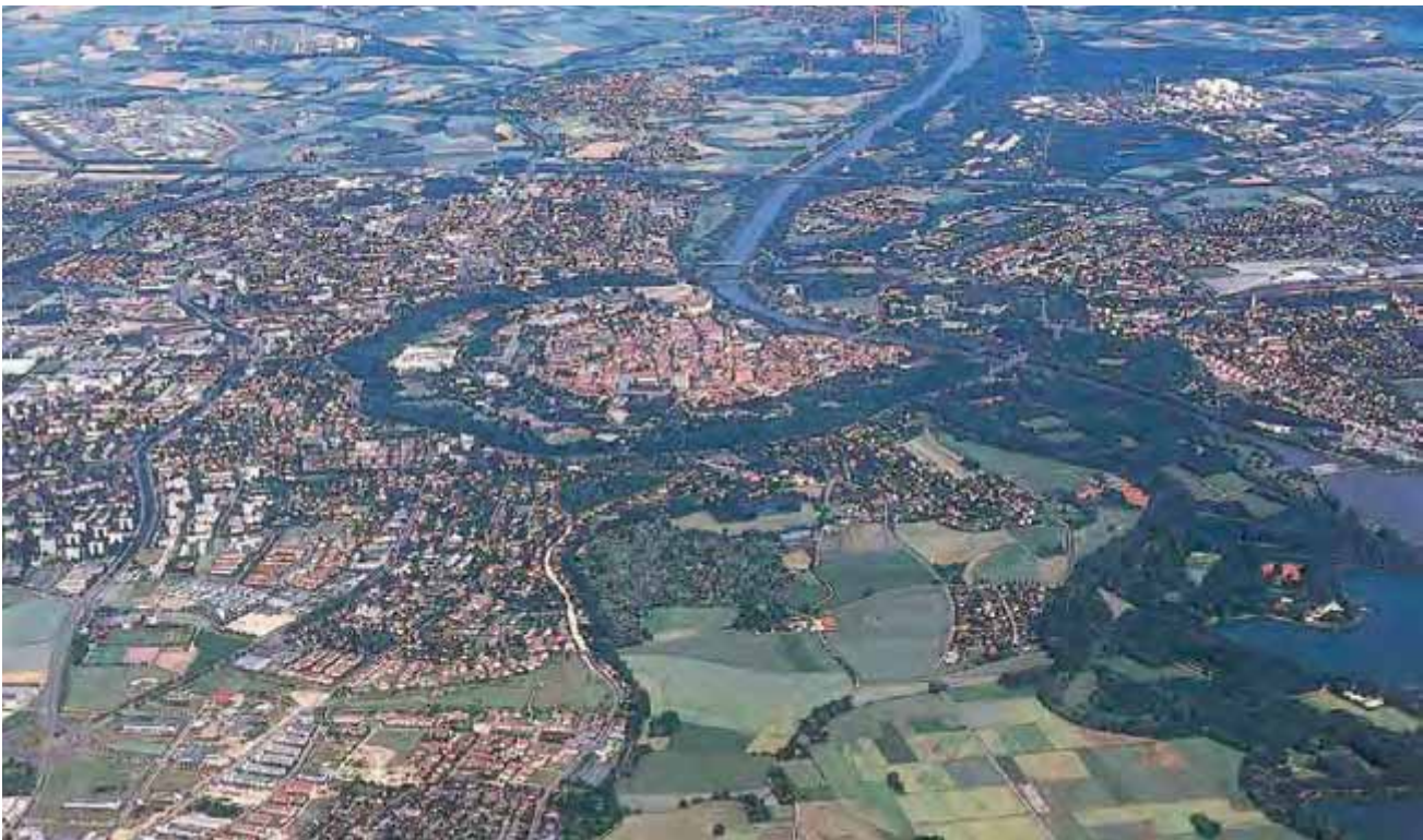
Abbildung 1: Luftbild der Stadt Ingolstadt

die Ingolstädter Bevölkerung, die bis heute aktiv in die Weiterentwicklung des Grünsystems eingebunden ist. Hierzu dient unter anderem ein aktuelles Parkpflegewerk. Derzeit wird der erste Grünring durch einen zweiten und dritten Grünring ergänzt, um eine weiter optimierte Versorgung der Bevölkerung mit wohnungsnahen Grünflächen sowie eine positive städtebauliche Entwicklung zu gewährleisten. Während der zweite Grünring in zwei bis drei Kilometer Abstand zum Altstadtkern ebenfalls ehemalige Militärfelder wie Forts und Vorwerke umfasst, die derzeit zum Teil zu Stadtteilparks entwickelt werden, bezieht der im Aufbau befindliche dritte Grünring auch siedlungsfernere Naherholungsflächen wie zum Beispiel ehemalige Kiesseen ein. Damit wird die Grundlage für ein erweitertes, qualitativ hochwertiges Grün- und Wegesystem in einem auch weiterhin im Wachstum befindlichem Siedlungssystem gelegt.