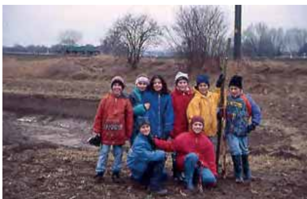
Abbildung 9: Bürgerpflanzaktion an der Einbogenlohe

In diesem Zusammenhang wurde von der Forschungsstelle für angewandte Regionalwissenschaften an der Katholischen Universität Eichstätt-Ingolstadt Daten zur Nutzungsintensität und zu Nutzungsmustern (Fuß- und Radverkehrszählungen, Passanten- und Besucheraufkommen im Glacis, Wegenutzung, Befragung zu Besuchs- und Aufenthaltsgründen, zum Attraktivitätspotential, zu Verbesserungsmöglichkeiten etc.) erarbeitet.