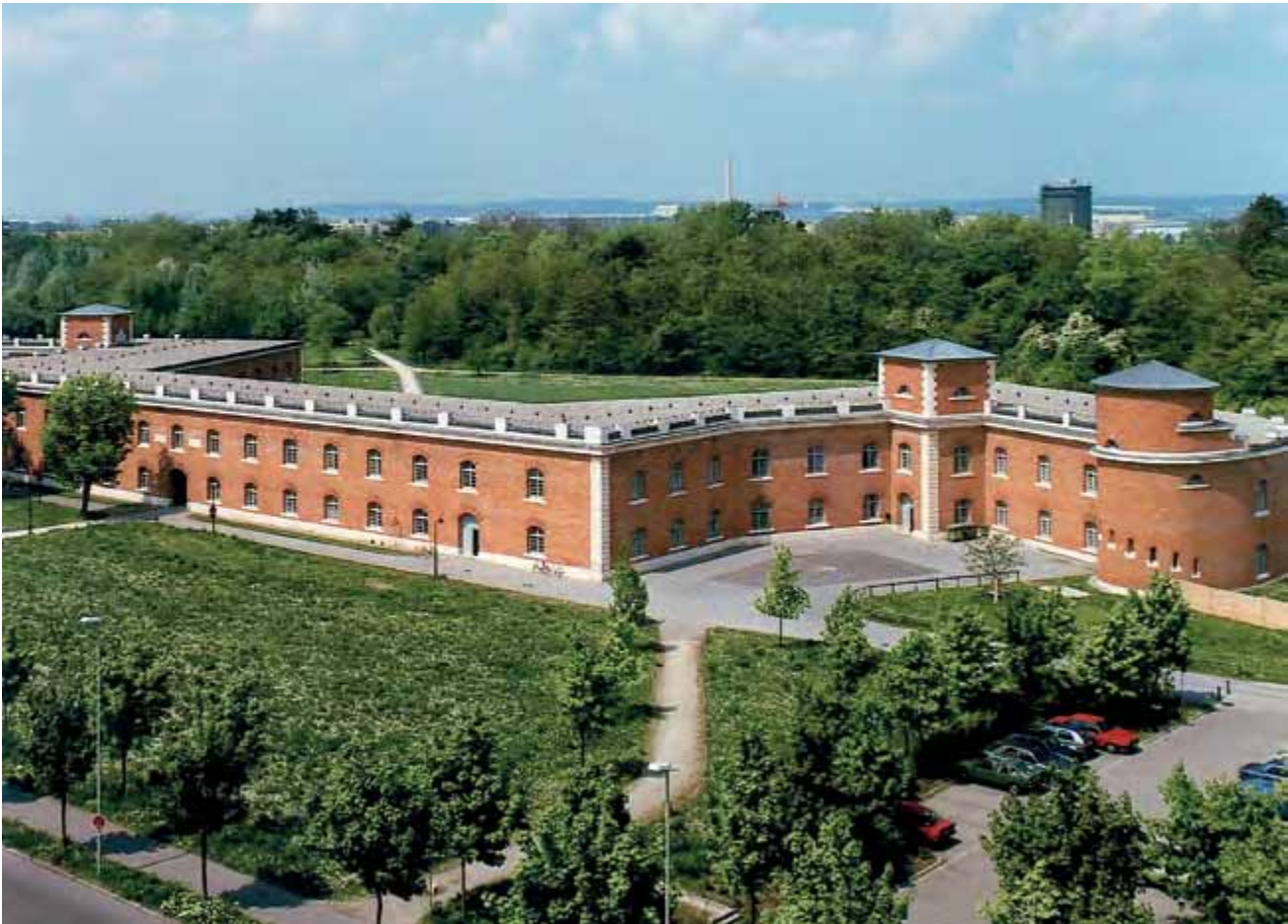
Abbildung 6: Glacis mit Festungsbauwerken