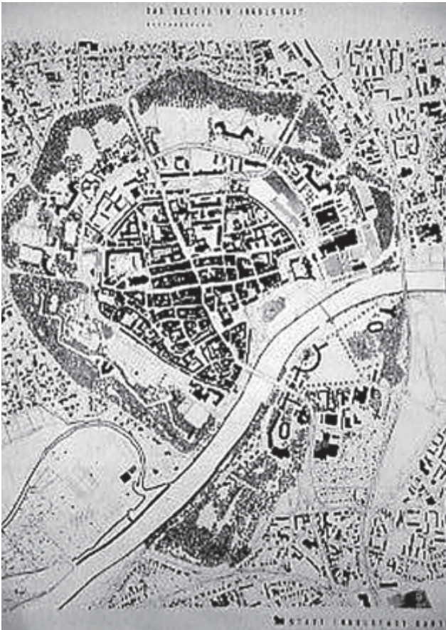
Abbildung 3: Historische Darstellung der Ingolstädter Festungsanlage (Gartenamt Ingolstadt 1989 unter Verwendung der topografischen Karte Ingolstadt, 1882)

(2. Bayerische Landesfestung), in denen ehemalige Glacisanlagen vollständig überbaut wurden oder auch im Vergleich zu den Städten Würzburg, Köln, Minden, Emden, Mainz und Ulm, deren festungsbedingten Freiflächen nur noch teilweise bis heute erhalten und erlebbar sind, hat das Ingolstädter Grünringssystem eine besondere Bedeutung. So ist in Ingolstadt der auf der Festung begründete Ring um die Altstadt außerordentlich gut erhalten. Die Breite (60 m-150 m), Lage und Ausformung entsprechen im Wesentlichen dem historischen Umfang. Die Freiflächen und Festungsrelikte der Stadt Ingolstadt stellen damit im bundesweiten Vergleich ein bemerkenswertes und besonders schutzwürdiges Gesamtensemble dar.