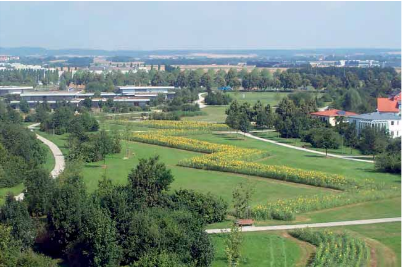
Abbildung 5: Der Fort-Haslang-Park

der Stadt ist hierfür der Fort-Haslang-Park mit etwa 13 ha oder im Osten der Stadtteilpark Mailinger Aue mit ca. 20 ha.