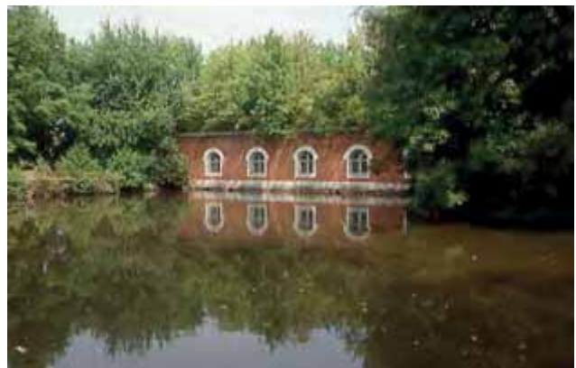
Abbildung 8: Der Künettegraben (Foto: Gartenamt Ingolstadt, 1991)

Entsprechend den Leitlinien der Deutschen Gesellschaft für Gartenkunst und Landschaftspflege (DGGL) zur Erstellung von Parkpflegewerken dient es als Instrument zur Verdeutlichung und Realisierung gartenpflegerischer Aufgaben. Gärten, Parks, Plätze und Anlagen wie Friedhöfe etc. von historischer Bedeutung bedürfen stetiger Betreuung, also vor allem gärtnerische Pflege in der Bandbreite von sehr hohem