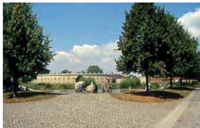
Abbildung 7: Der Leo von Klenze-Park

und Geschößfabrik eingezäunt wurde, ging dieser attraktive Teil für die Bevölkerung verloren. Geplante Rodungen versuchte der Stadtmagistrat zu verhindern, „da die gesamte Glacisanlage dem Naturschutz unterliege“. Mit der Auflösung der Geschößfabrik Schubert & Salzer und dem Abbruch der meisten industriell genutzten Gebäude Mitte der neunziger Jahre erfährt das Gelände gegenwärtig eine Neuordnung. Damit konnte mit dem hier angelegten Glacisabschnitt „Klenzepark“ und seiner planungsrechtlichen Umwidmung vom Industriegelände zur öffentlichen Grün-