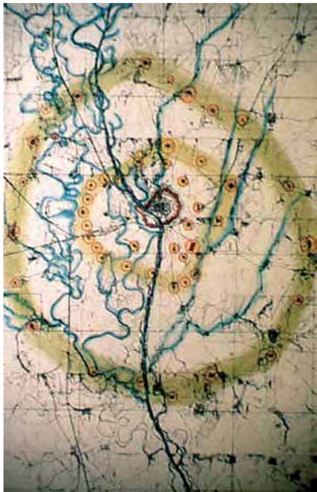
Abbildung 4: Die drei Grünringe Ingolstadts (Gartenamt Ingolstadt, 2004)

Der zweite Grünring um Ingolstadt befindet sich ungefähr in einem Abstand von zwei bis drei Kilometer Entfernung vom Zentrum der Altstadt. Er ist wie der erste Grünring, das Glacis, militärischen Ursprungs, und umfasst ehemalige Vorwerke und Forts. Hier wurden in den vergangenen Jahren, Stadtteilparks mit Spiel und Sportflächen und sonstige grünbetonte Einrichtungen des Gemeinbedarfs auf einer Fläche von ca. 50 ha angelegt. Ein Beispiel im Westen