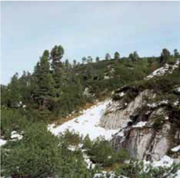
Abbildung 3: Hochsubalpiner Lärchen-Zirbenwald (FFH-Lebensraumtyp 9420) auf dem Karstplateau der Reiter Alm (Nationalpark Berchtesgaden)

erischen Grenzgebirge ist mit einem Verschwinden der subalpinen Fichtenstufe zu rechnen (BÄSSLER et al. in Druck). In den Bayerischen Alpen würde die Fichtenstufe selbst dann an Fläche verlieren, wenn sich ausgehend von Vorposten in Latschengebüschen der heutigen hochsubalpinen Stufe (EWALD & KÖLLING 2009, Abb. 2) neue Fichtenwälder entwickeln. Lärchen-Zirbenwälder (Abb. 3) gehören zu den am stärksten gefährdeten Lebensraumtypen Bayerns, insbesondere weil die Zirbelkiefer bereits heute die wärmeren Tallagen der Alpen meidet (EWALD & KÖLLING 2009). Der erwärmungsbedingte Verlust von Latschengebüschen könnte durch vermehrtes Brachfallen von Hochalmen kompensiert werden. In den subalpinen Habitaten ist bei Einwandern von Laubbaumarten der montanen Bergmischwälder mit einer Zunahme der Baumartenvielfalt und mit einer Abnahme der Moosartenvielfalt zu rechnen (EWALD 2008).