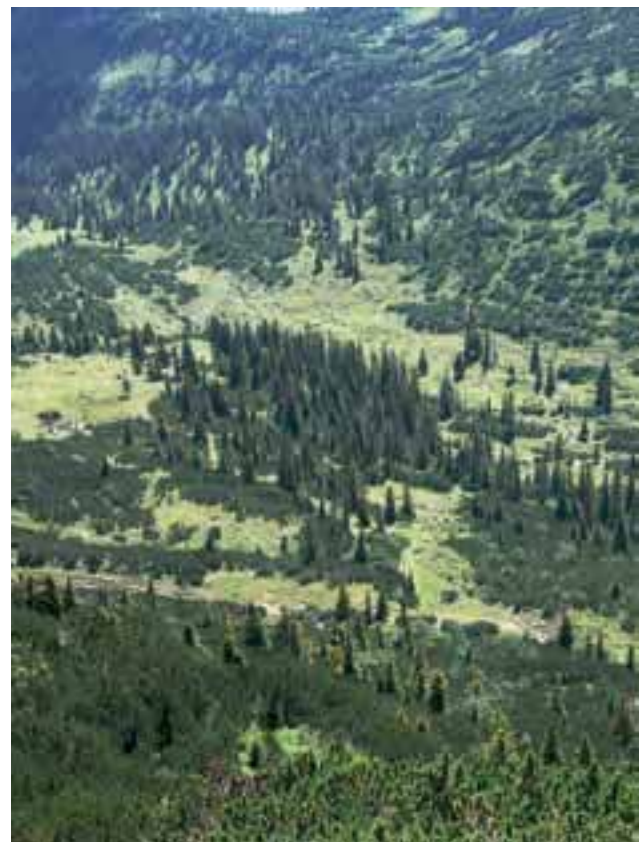
Abbildung 2: Subalpine Alpendost-Fichtenwälder (FFH-Lebensraumtyp 9410), Alpenrosen-Latschengebüsche (LRT 4070) und extensive Almflächen auf dem Karstplateau südlich der Hohen Kisten (Estergebirge, Lkr. Garmisch-Partenkirchen)

Nach KÖLLING & ZIMMERMANN (2007) sind alle natürlichen Nadelwaldgesellschaften (Abb. 2, 3) einschließlich der Moorwälder (Abb. 4) durch Klimawandel besonders stark gefährdet (Tabelle 1). Im ostbay-