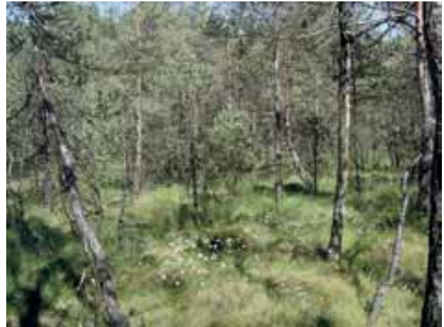
Abbildung 4: Rauschbeeren-Waldkiefernwald (FFH-Lebensraumtyp 91D0 *) in einem Übergangsmoor im Schönrammer Filz (Landkreis Berchtesgadener Land)

Das künftige Areal der mesophytischen Buchenwälder hängt davon ab, ob Verluste in den warm-tro-