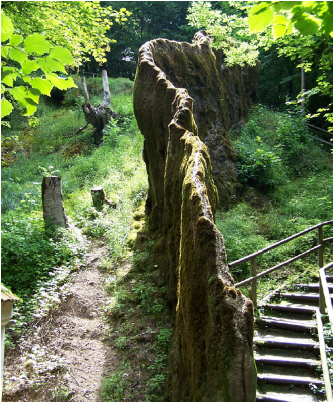
Wachsender Felsen Usterling / Helmut Höbler

Unter dem Motto „Ganz meine Natur!“ wird in dem von der EU geförderten Projekt „LIFE living Natura 2000“ auf die Bedeutung von Schutzgebieten in Bayern verstärkt aufmerksam gemacht. Die Bayerische Akademie für Naturschutz hat für die Kommunikation des Themas Natura 2000 in Bayern im Rahmen des genannten Projektes die Federführung übernommen.