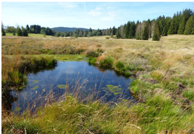
Tal der Kalten Moldau

Bitte geben Sie hierzu Ihren Namen und Ihre Anschrift zum Versand der Karten an, sowie deren Anzahl.