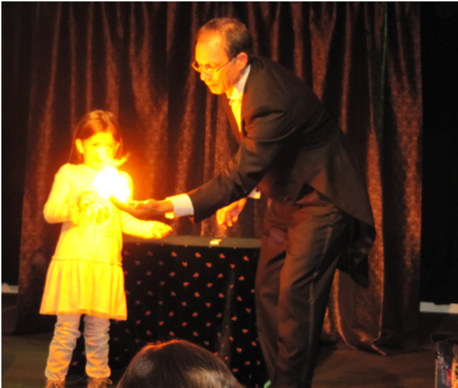
Zauberei / Gerald Forster