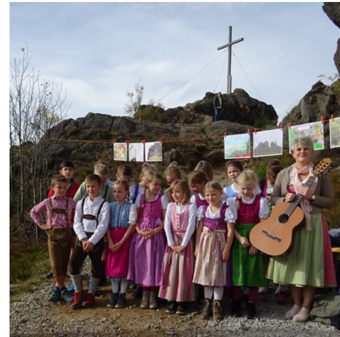
Schulkinder aus Bodenmais