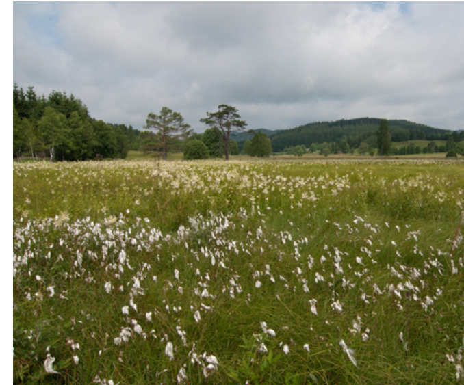
Schnellenzipf im Bayerischen Wald / Wolfgang Lorenz

Kommunen und Behörden, Bildung und Religion, Land- und Forstwirtschaft, Jagd und Fischerei, Naturschutz und Landschaftspflege