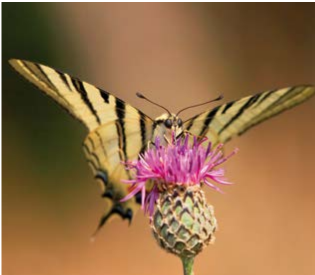
Abb. 4: Der sehr wärmebedürftige Segelfalter ( Iphiclides podalirius ) kommt in der Oberpfalz auf Kalkmagerrasen vor. Die Population ist abhängig von der fachgerechten Pflege der Lebensräume, die vor allem durch eine maßvolle Beweidung durch wandernde Schafherden gewährleistet werden kann.

falter ( Iphiclides podalirius , Abbildung 4), Ehrenpreis-Schreckenfaller ( Melitaea aurelia ) und Flockenblumen-Schreckenfaller ( Melitaea phoebe ) richten.