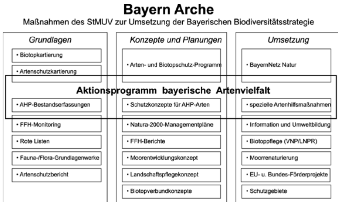
Abb. 2: Die unter der gemeinsamen Dachmarke „Bayern Arche“ zusammengefassten Instrumente des Bayerischen Staatsministeriums für Umwelt und Gesundheit zur Umsetzung der Bayerischen Biodiversitätsstrategie. Für das „Aktionsprogramm bayerische Artenvielfalt“ wird ein Teil davon genutzt, was durch die Überlappung der Felder dargestellt ist.

willigkeit und Kooperation. Jedes Vorhaben erstreckt sich auf ein Gebiet von mindestens 1 km 2 Größe und ist von den Naturschutzbehörden als wertvoller Beitrag zum Naturschutz anerkannt.