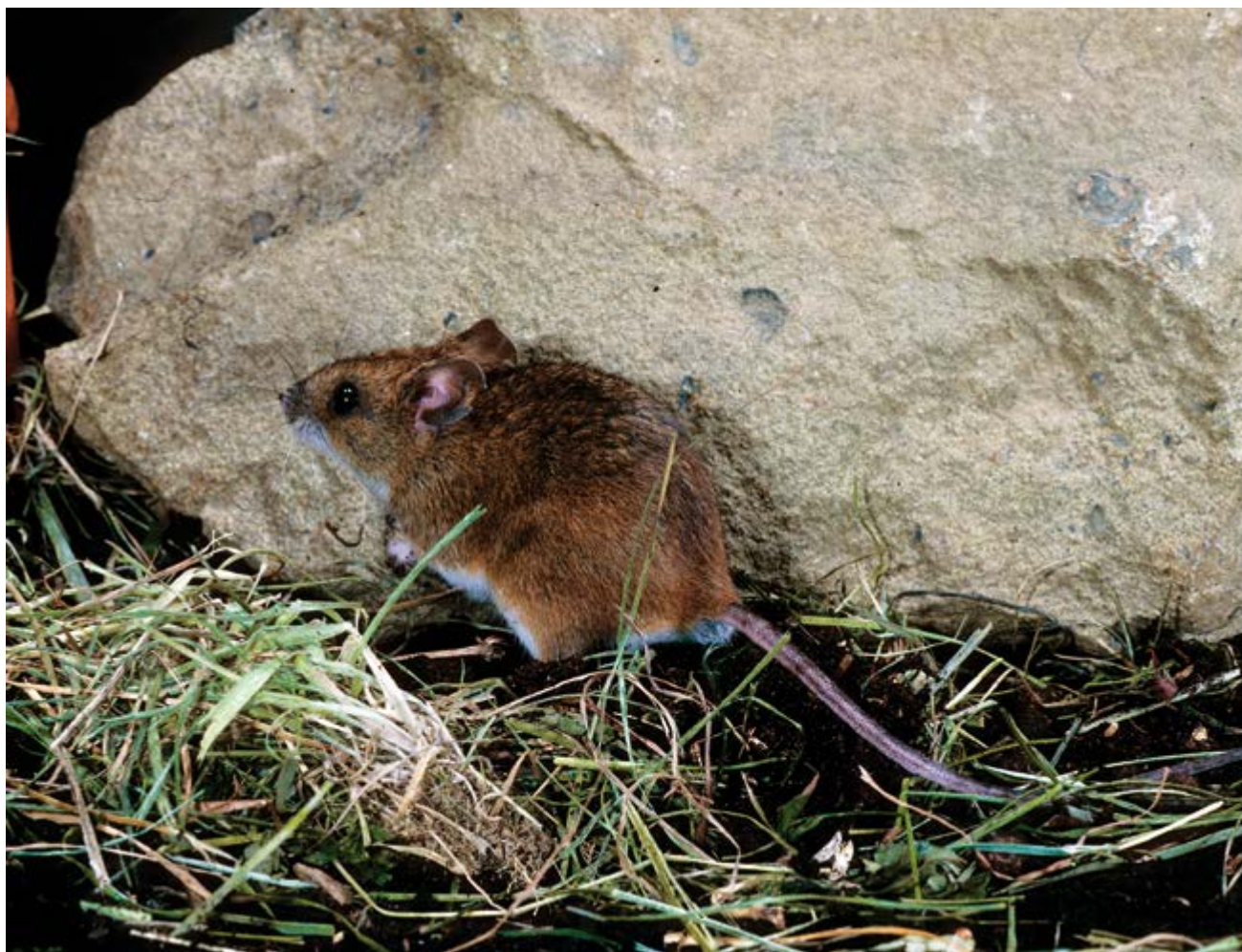
Abb. 1: Die Alpenwaldmaus ( Apodemus alpicola ) kommt nur in den Hochlagen der Alpen vor. Über ihre Verbreitung in den bayerischen Berggebieten ist bisher fast nichts bekannt. Doch es besteht kein Zweifel, dass sie durch den Klimawandel bedroht wird, weil die konkurrierenden Arten Waldmaus ( Apodemus sylvaticus ) und Gelbhalsmaus ( Apodemus flavicollis ) im Zuge der Erwärmung in die Lebensräume der Alpenwaldmaus vordringen können (Foto: Peter Boye).

Von den in Bayern lebenden Tieren, Pflanzen und Pilzen, die für die Rote Liste der gefährdeten Arten untersucht wurden, sind über 40 Prozent bedroht. 5,7 Prozent seiner Tierarten und 3,5 Prozent seiner Pflanzenarten hat Bayern bereits verloren. Alarmierend ist der Rückzug vieler ehemals häufiger Arten aus weiten Landesteilen (StMUG 2010).