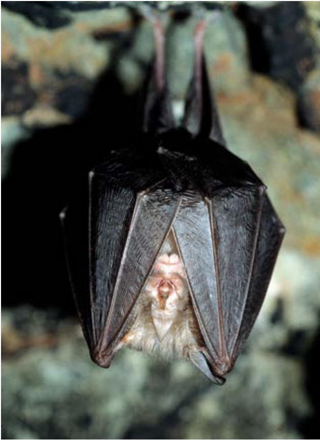
Abb. 3: Bei der Kleinen Hufeisennase ( Rhinolophus hipposideros ) bietet sich die Chance, eine noch als vom Aussterben bedroht eingestufte Art nicht nur zu retten, sondern ihre Bestände so zu entwickeln, dass sie ihr ursprüngliches Verbreitungsgebiet in Bayern zurückerobern kann.