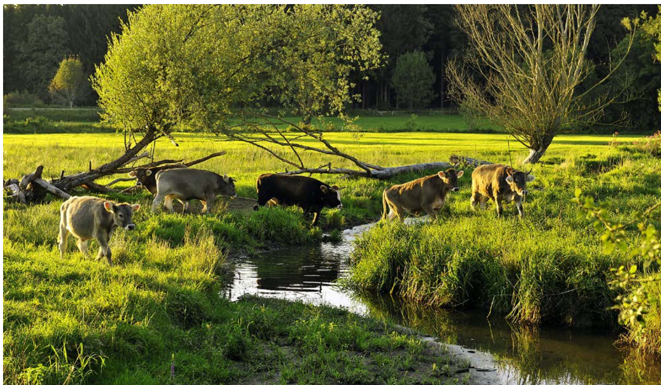
Abb. 3: Strukturreiche Weide im Günztal mit „Original Braunvieh“. Beweidung wird zum Erhalt aber auch zur Wiederherstellung strukturreicher Auenlandschaften eingesetzt.

fundierten und akzeptierten Umsetzung der Maßnahmen führen soll. Naturverträgliche Nutzungskonzepte werden mit Flächenbesitzern, Fachbehörden und kooperierenden Gemeinden erarbeitet und in fokussierten Zielgebieten möglichst rasch umgesetzt. Dabei sollen flankierende Angebote zur Umweltbildung und Öffentlichkeitsarbeit, wie Exkursionen, Landschaftsrundgänge für beteiligte Flächennutzer und Gemeinden sowie Bildungsprogramme für Kinder und Jugendliche eine breite Akzeptanz schaffen.