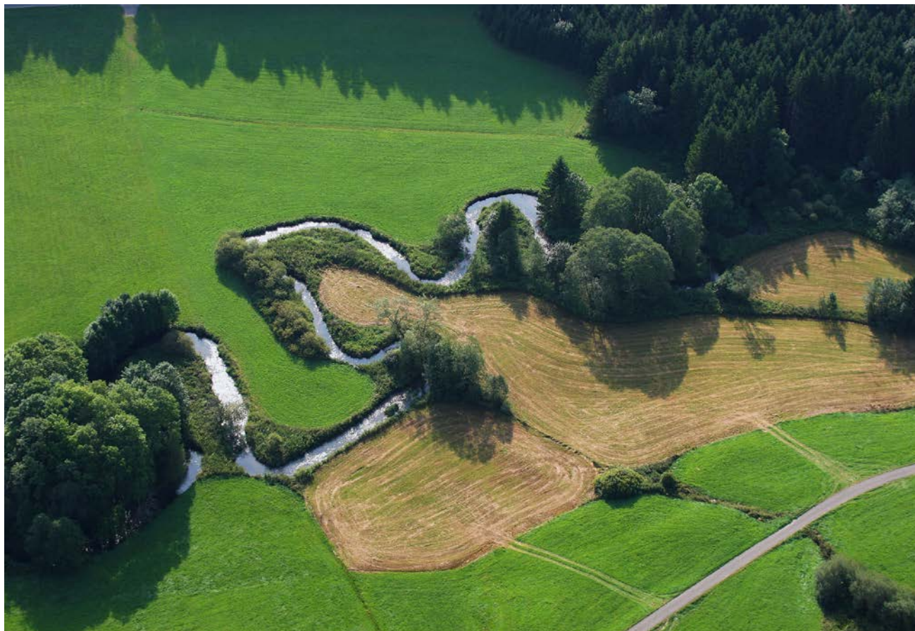
Abb. 1: Nur noch in wenigen Abschnitten schlängelt sich die Günz durch die Landschaft und ist von artenreichen Streuwiesen begleitet, die es zu schützen oder wiederherzustellen gilt.