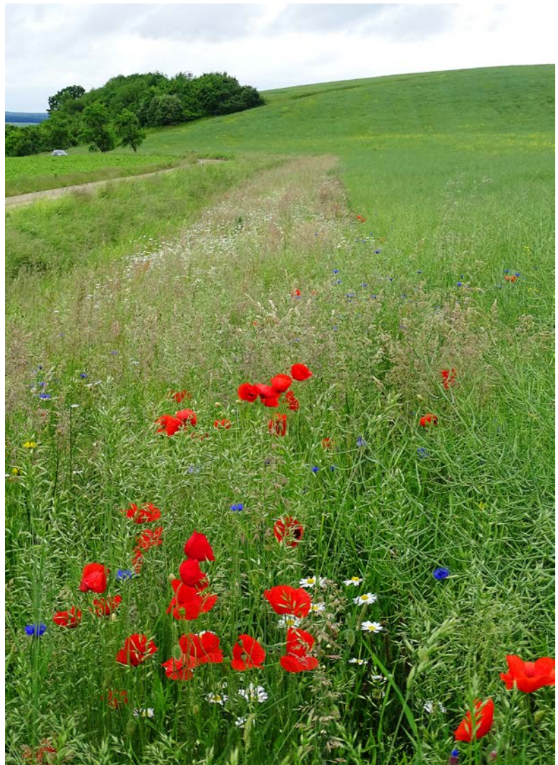
Abb. 1: Erhöhung der Biodiversität im Agrarraum – Ein Feldrandstreifen wurde in Absprache zwischen Landwirt und Wildlebensraumberater mit einer artenreichen, regionalen Saatgutmischung aus 40 verschiedenen Pflanzenarten angesät.

Im Kern speist sich die Auswahl an lebensraumverbessernden Maßnahmen aus drei Säulen. Zum einen aus dem (1) Bayerischen Kulturlandschaftsprogramm (KULAP), dem (2) Greening und aus (3) nicht förderfähigen Maßnahmen. Ein Erfolgsbaustein der Wildlebensraumberatung ist, dass die bestehenden KULAP-Maßnahmen und Greening-Varianten passend zur jeweiligen Betriebsstruktur ausgewählt und dann praxistgerecht in die Fläche gebracht werden. Die Beratung ist kostenfrei