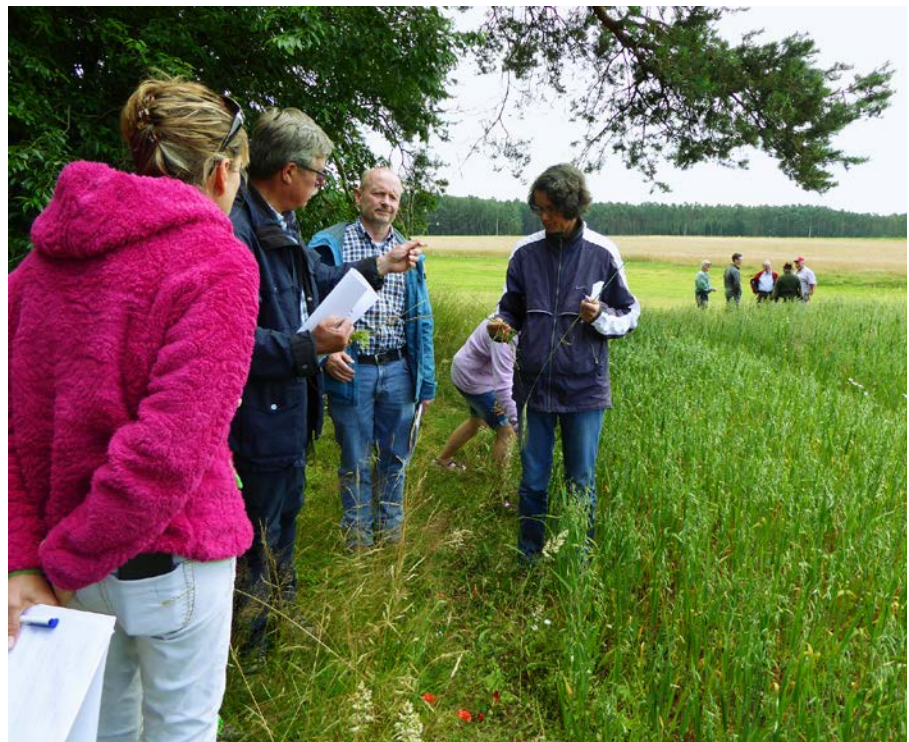
Abb. 3: Ackerwildkrautberatung auch zu den seltenen Arten, wie den Lämmersalat Amoseris minima.

Ein Privatmann kartierte im Auftrag des Bund Naturschutz seit mehreren Jahren die Ackerflächen der Region bezüglich ihrer Ackerwildkrautvorkommen. Besonders bedeutsam ist der europaweit stark gefährdete Lämmersalat ( Amoseris minima ). Die kleinwüchsige Pflanze benötigt nährstoffarme Böden und lichte Pflanzenbestände. Die Wildlebensraumberaterin wurde von den Initiatoren zur Unterstützung hinzugezogen. Sie besichtigte