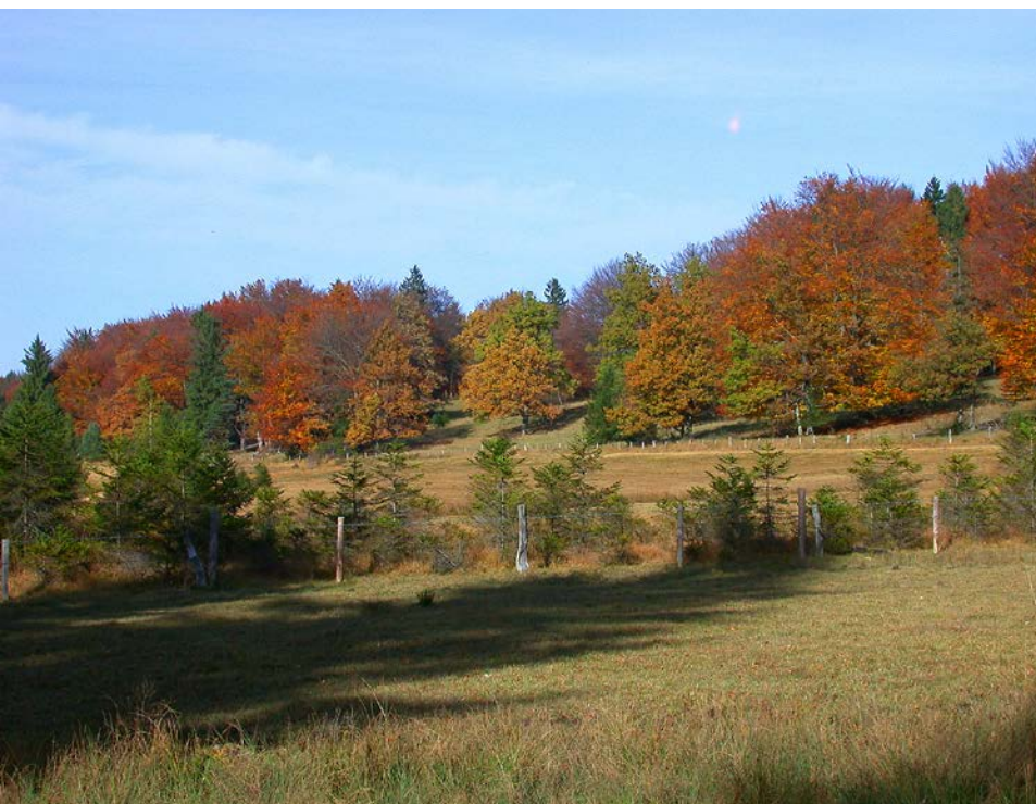
Abb. 4: Hutelandschaft mit Solitäräbäumen.

Schon der flüchtige Vergleich mit den benachbarten Flächen im Hartschimmelgebiet zeigt, dass diese Verhältnisse nicht ohne Weiteres und in einem überschaubaren Zeitraum wiederhergestellt werden können, wenn sie einmal gestört worden sind. Das Zusammenspiel von Vegetation und Mikroorganismen wie Pilzen und Bakterien