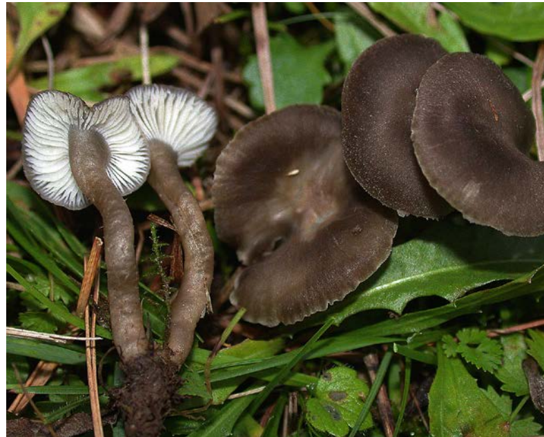
Abb. 1: Schulzers Samtschneckling ( Camarophylloopsis schulzeri ) wurde erstmals auf der Goaslweide für Bayern nachgewiesen.

Die Tabelle 1 gibt einen Überblick über die untersuchten Artengruppen und deren nachgewiesenen Artenzahlen