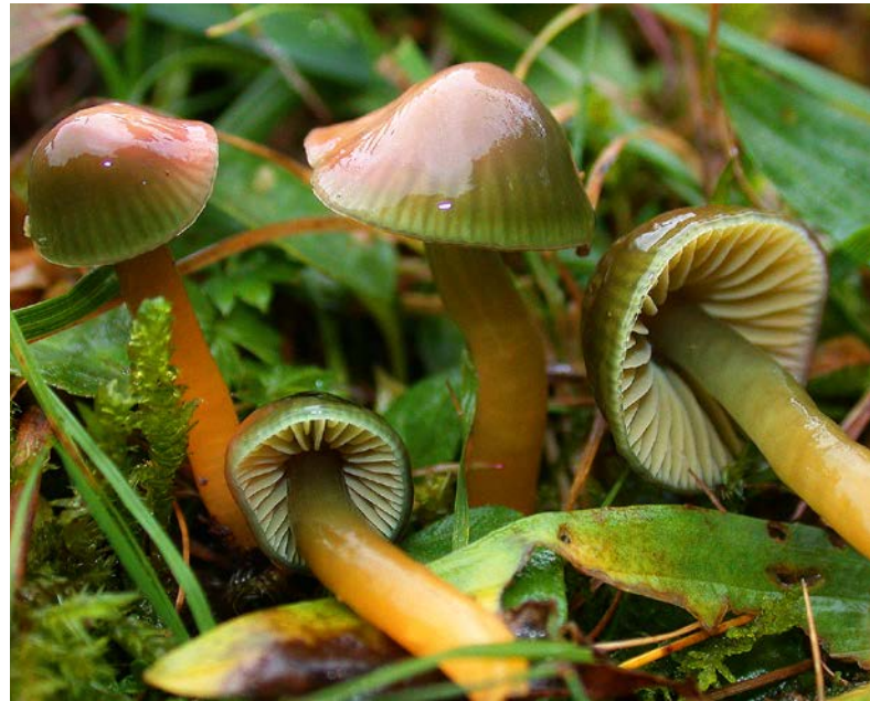
Abb. 3: Der farbenfrohe Papageiensaftling ( Hygrocybe psittacina ) gehört zu den CHEG-Pilzen.

Nischenreichtum schafft Diversität. Dies ist im Naturschutz allgemein anerkannt. Es muss auch betont werden, dass die Untersuchungsfläche erst durch menschliche Nutzung so artenreich geworden ist. Die traditionelle, bäuerliche Landbewirtschaftung ohne Kunstdünger