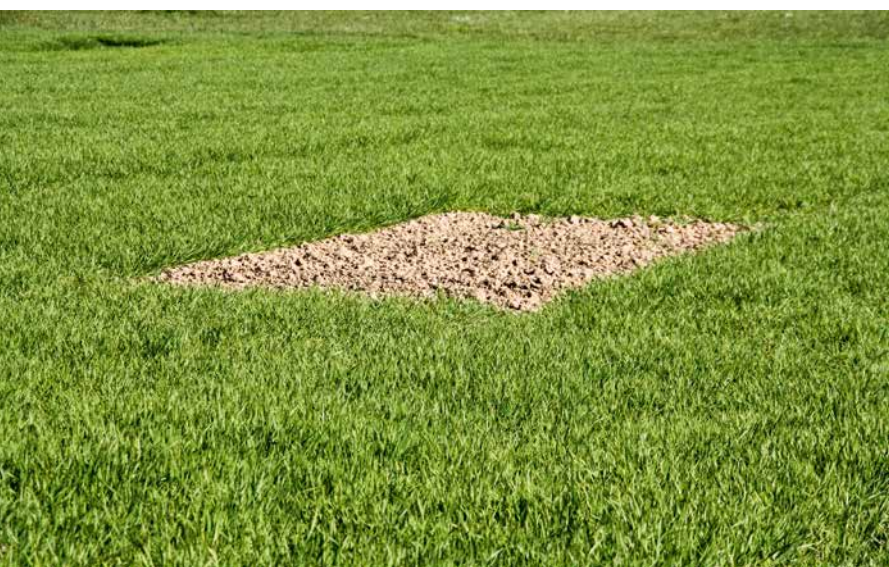
ABBILDUNG 2 Felderchenfenster sind mit geringem Aufwand in den Ackerbau zu integrieren.

Auch freiwillige Initiativen zeigen, dass sich gute Ideen oft mit machbarem Aufwand in die landwirtschaftlichen Betriebe integrieren lassen. Mit dem von BBV und Landesbund für Vogelschutz in Bayern (LBV) durchgeführten Projekt zur Anlage von Feldlerchenfenster wurden diese in Bayern bekannt gemacht. Darüber hinaus bewirbt der BBV in Kooperation mit dem Landesverband der Bayerischen Imker seit mittlerweile sieben Jahren die Anlage von Blühenden Rahmen. Blühstreifen sind dadurch mittlerweile zu einem festen Bestandteil der bayerischen Kulturlandschaft und Nahrungsquelle und