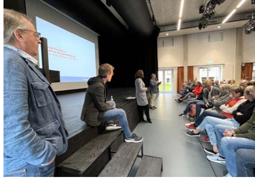
Abbildung 5: Bürgerbeteiligung in Penzberg mit Vertretern der Stadt sowie des Planungsteams USP München/BBP Kaiserslautern.