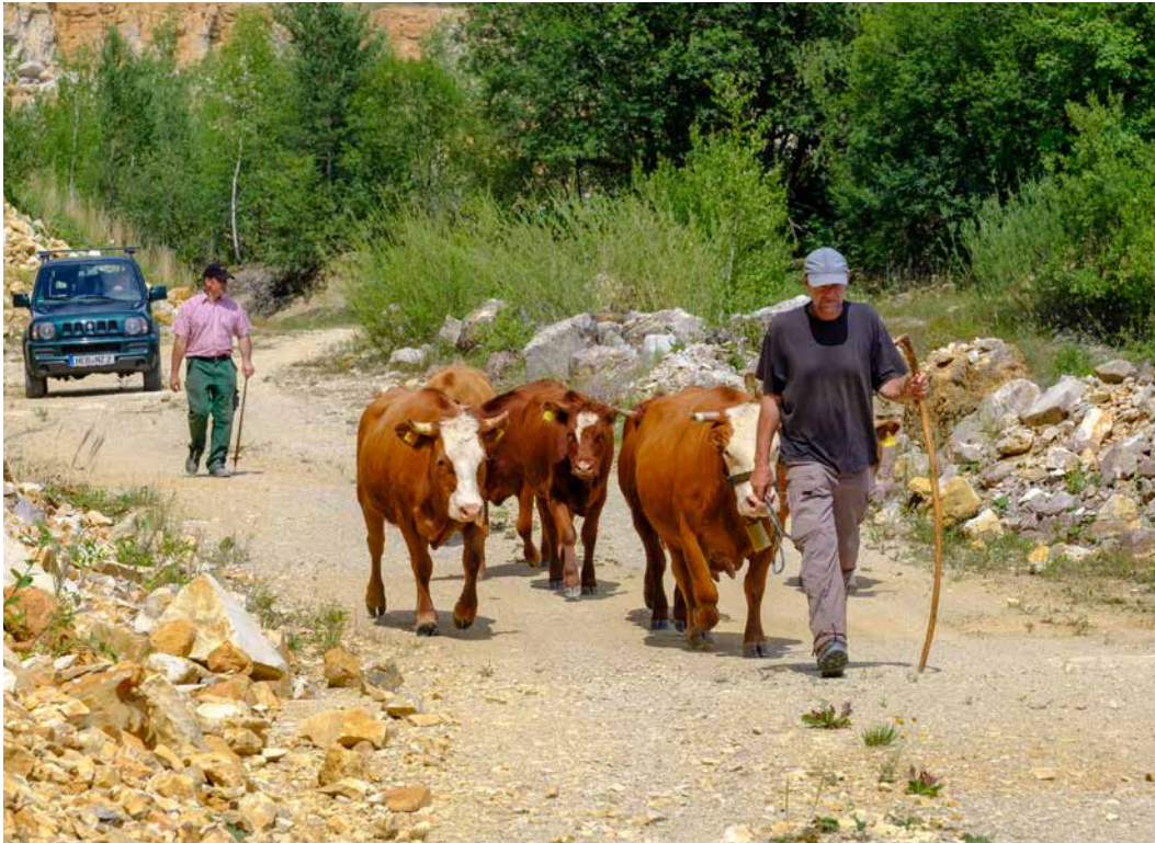
Abbildung 4: Hirte beim Weideumtrieb; in kleinstrukturierten Landschaften müssen die Tiere oft umgetrieben werden, hier ist es wichtig, gut und effizient mit den Tieren zu arbeiten.

Genauso wichtig ist es, auf die Entwicklung der Flächen zu achten. Über- aber auch Unterbeweidung beeinflussen die Qualität des Biotopes. Kleinstrukturierte Weideflächen sind sehr störungsanfällig und es erfordert eine gezielte, fachlich abgestimmte Weideführung.