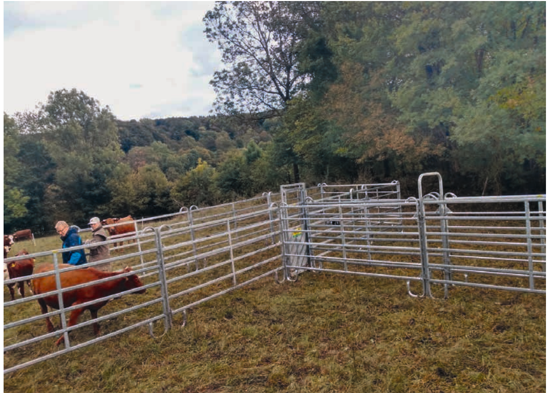
Abbildung 5: Mobile Fanganlage für Tierbehandlungen und Einfangen der Tiere zum Transport

Vergleich zur mechanischen Flächenpflege arbeiten die Tiere wirtschaftlicher, aber die aktuelle Förderung stellt dies derzeit noch nicht leistungsgerecht dar.