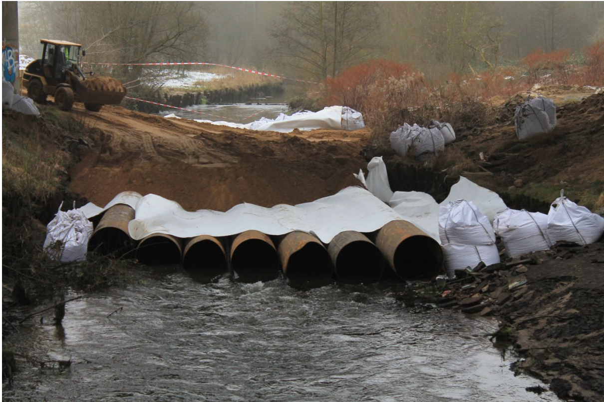
Abbildung 1: Baubedingte Auswirkungen bei einem Brückenersatzneubau.

(bitte keinerlei Formatierungen, wie z. B. Blocksatz, automatische Aufzählungen, unterschiedliche Zeilenabstände etc. verwenden – und keinerlei Abkürzungen!)