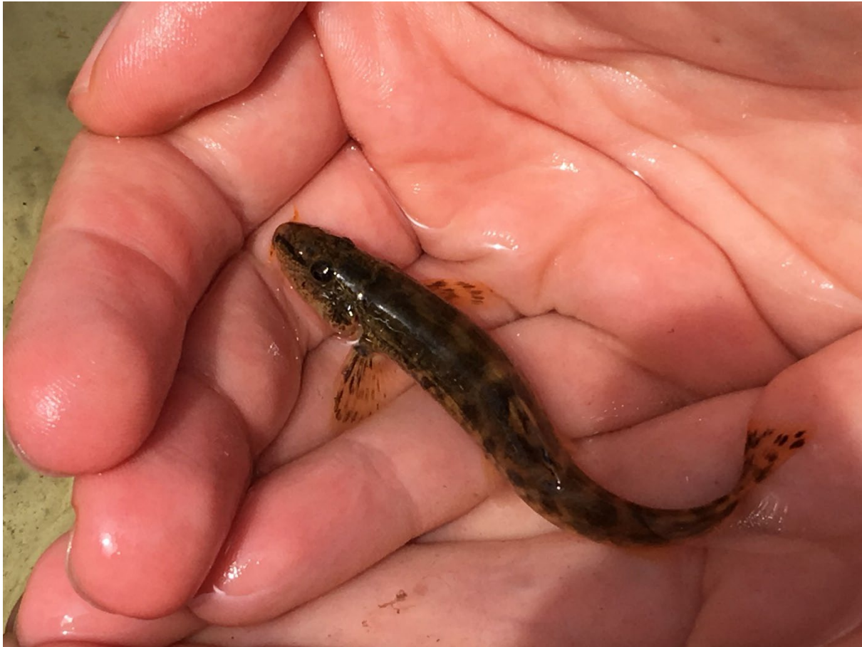
Abbildung 4: Die Fischfauna ist eine der vier biologischen Qualitätskomponenten zur Bewertung von Oberflächengewässern. Hier eine Schmerle, die bei einer Elektrofischung gefangen wurde.

Bildbeschriftung für Sehbehinderte: Nahaufnahme einer etwa fingerlangen Schmerle in den Händen eines Kartierers.