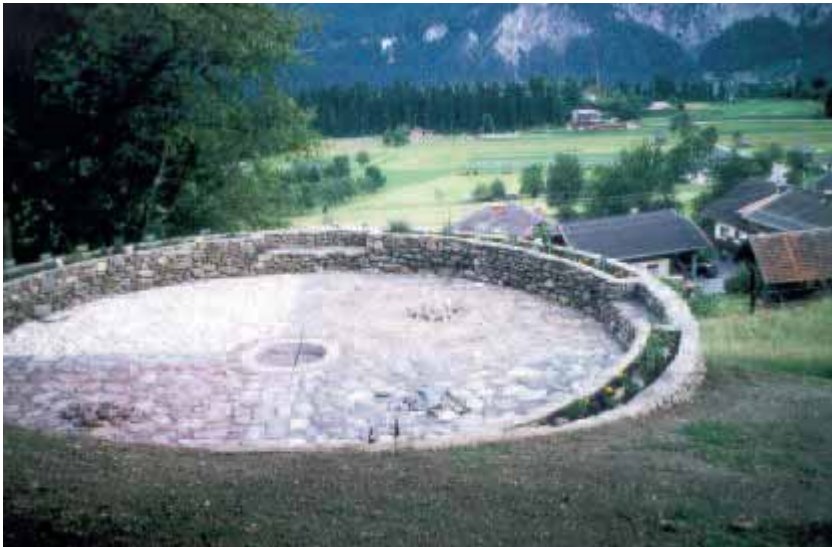
ABB. 8: KRÄUTERKRAFTKREIS IRSCHEN

Naturschutzgebiete Ammergebirge – Außerfern – Lechtaler Alpen