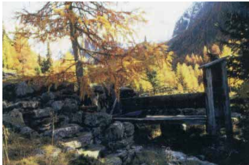
ABB. 2: ERD-BETONTE RAUMQUALITÄT

sind neben den traditionellen Themenwegen, Naturlehrpfaden und dgl. auch neue Formen der Landschaftswahrnehmung zu überlegen. Etwa die bewußte Wahrnehmung der vier Elemente “Feuer” – “Erde” – “Luft” - “Wasser” in der Landschaft - jener seit altersher von verschiedenen Kulturen erkannten Grundbausteine und Urqualitäten des Lebens, die sich sowohl im psychischen als auch im physischen Bereich von Mensch und Landschaft ausdrücken und bei entsprechender Beschäftigung eine besonders intensive Beziehung des Menschen zur Landschaft entstehen lassen (Abbildungen 2 – 5).