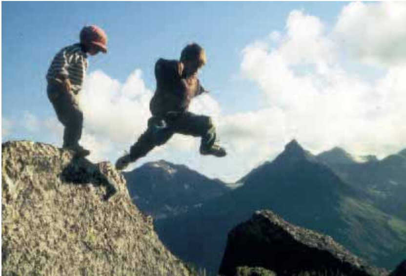
ABB. 4: LUFT-BETONTE RAUMQUALITÄT

Naturschutzgebiete Ammergebirge – Außerfern – Lechtaler Alpen