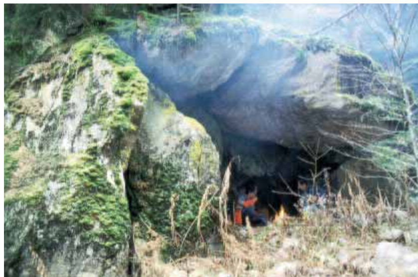
ABB. 3: FEUER-BETONTE RAUMQUALITÄT