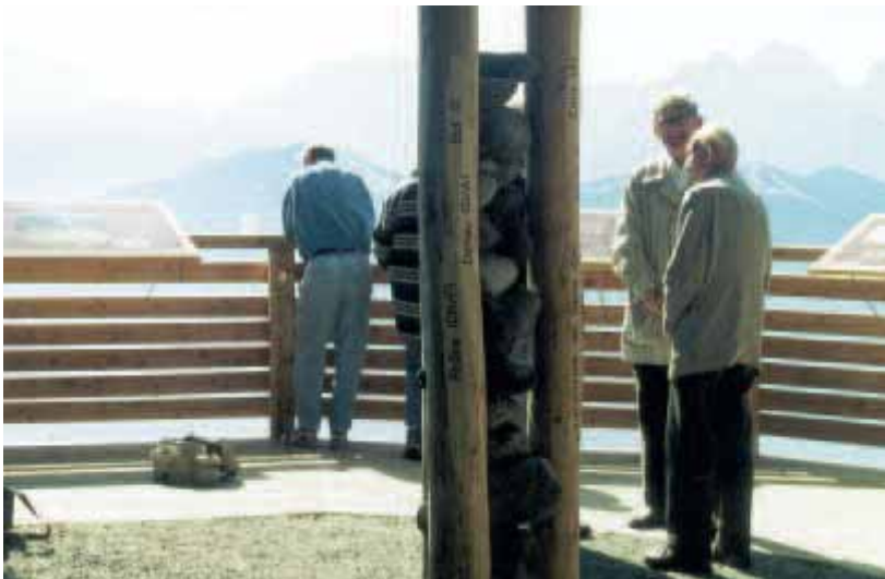
ABB. 9: LEBEN IST BEGEGNUNG – AUSSICHTSWARTE ROTE WAND AM DOBRATSCH BEI VILLACH

IM „NATUR- UND KRÄUTERDORF IRSCHEN“ WURDE ETWAS ABSEITS DES GEMEINDEZENTRUMS EIN KRÄUTERKRAFTKREIS ERRICHTET (HIER IN DER BAUPHASE). DURCH DIE ENGAGIERTE MITARBEIT DER GEMEINDEBÜRGER ENTSTAND EIN BESONDERER ORT, DER NICHT NUR WUNDERSCHÖNE AUSSICHTEN BIETET, SONDERN AUCH DIE KRÄUTERREICHE IRSCHENER KULTURLANDSCHAFT ALS REGIONALES „MARKENZEICHEN“ BETONT.