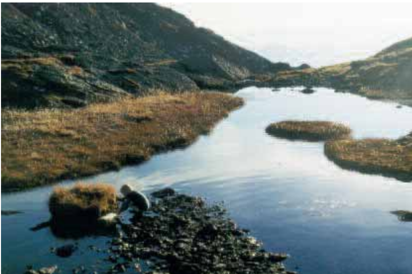
ABB. 5: WASSER-BETONTE RAUMQUALITÄT

Alles, was geschieht, ist symbolisch und indem es sich selbst darstellt, deutet es auf das übrige. (J. W. Goethe)