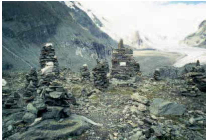
ABB. 6: STEINZEICHENAKTION IM NATIONALPARK HOHE TAUERN

NACH DEM MOTTO „WIR SIND EIN TEIL DER ERDE - GEMEINSAM EIN ZEICHEN SETZEN FÜR DIE ZUKUNFT“ GESTALTEN WANDERER AN DER GROßGLOCKNER HOCHALPENSTRAßE UNTERHALB DES ELISABETHFELSENS EINEN ORT, DER SYMBOLHAFT DIE IDEEN UND ZIELE DES NATIONALPARKS HOHE TAUERN WIDERSPIEGELT.