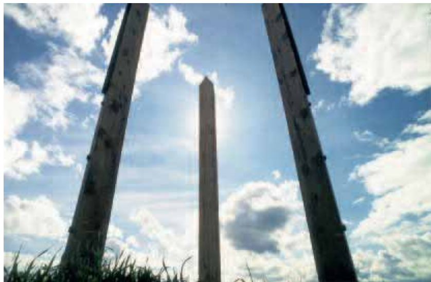
ABB. 7: WEGWEISER FÜR MORGEN

NACH DEM MOTTO „WIR SIND EIN TEIL DER ERDE - GEMEINSAM EIN ZEICHEN SETZEN FÜR DIE ZUKUNFT“ GESTALTEN WANDERER AN DER GROßGLOCKNER HOCHALPENSTRAßE UNTERHALB DES ELISABETHFELSENS EINEN ORT, DER SYMBOLHAFT DIE IDEEN UND ZIELE DES NATIONALPARKS HOHE TAUERN WIDERSPIEGELT.