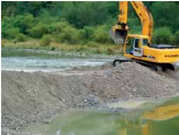
Abbildung 5: Laichplatzrestaurierung per Kieszugabe am Lech, Deutschland