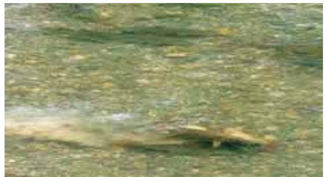
Abbildung 8: Laichende Barben im Frühjahr 2009 auf einem neu geschaffenen Laichplatz im Lech bei Scheuring