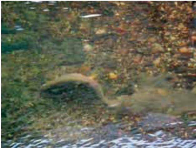
Abbildung 1: Weibliche Bachforelle beim Nestbau