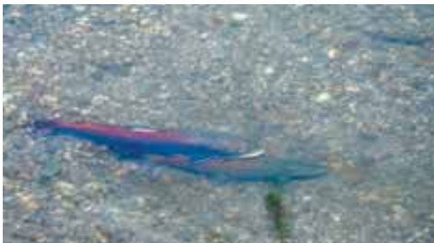
Abbildung 7: Laichende Huchen auf einem 2007 neu geschaffenen Kieslaichplatz im Lech