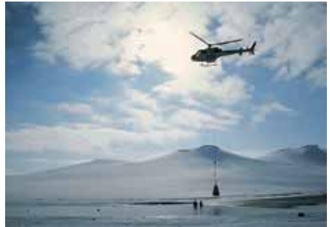
Abbildung 6: Laichplatzrestaurierung per Kieszugabe am Auslauf des regulierten Bjornesfjorden, Norwegen