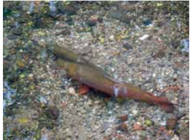
Abbildung 2: Bachforellenpaar auf einer Laichgrube in der Schleifermoosach

der Salmoniden) bauen Nester im Substrat von Kiesbänken („Laichgruben“, siehe Abbildung 1 und Abbildung 2), Substratlaicher (vor allem Vertreter der Cypriniden) legen ihre Eier auf der Substratoberfläche von Kiesbänken ab (BALON 1975, PULG 2009, siehe Abbildung 8).